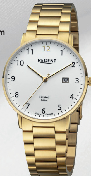
GM-2301 Edelstahl IPG, Saphirglas, 5 Bar UVP 258,00 €