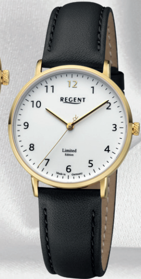
GM-2307 Edelstahl IPG, Saphirglas, 5 Bar UVP 198,00 €