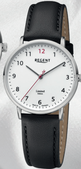
GM-2306 Edelstahl, Saphirglas, 5 Bar UVP 188,00 €