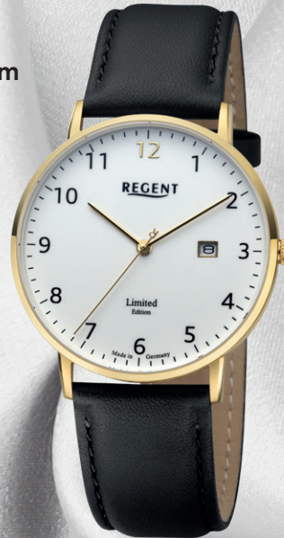
GM-2303 Edelstahl IPG, Saphirglas, 5 Bar UVP 198,00 €