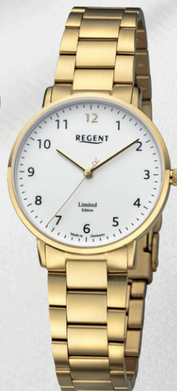
GM-2305 Edelstahl IPG, Saphirglas, 5 Bar UVP 258,00 €