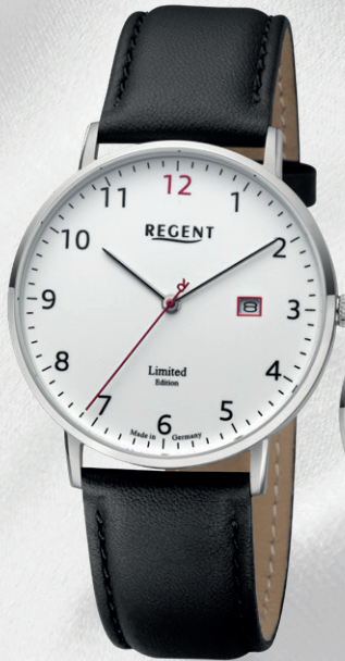
GM-2302 Edelstahl, Saphirglas, 5 Bar UVP 188,00 €