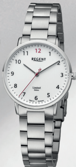
GM-2304 Edelstahl, Saphirglas, 5 Bar UVP 238,00 €