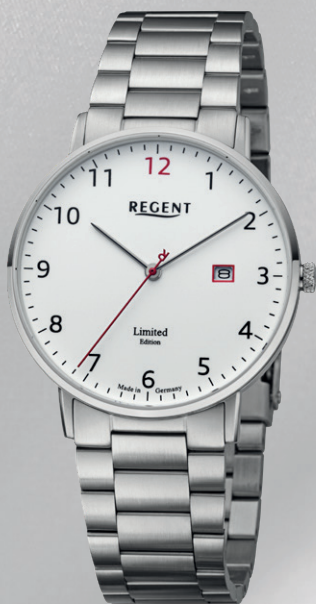
GM-2300 Edelstahl, Saphirglas, 5 Bar UVP 238,00 €