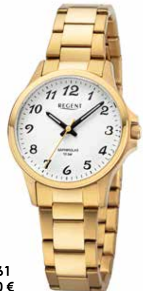
F-1461 99,00 €

Edelstahl + Edelstahl IPG, Saphir, 10 Bar, Ø 32 mm, DruckfaltschlieÙe