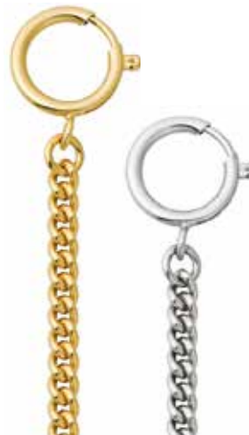
P-46 28,00 €

vergoldet + vernickelt, Rundpanzer, 5 mm