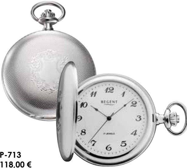
P-713 118,00 €