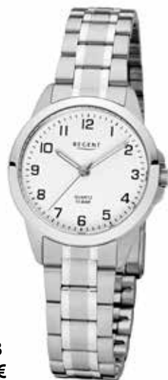
F-1003 59,90 €