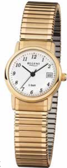
F-890 59,90 €

Edelstahl + Edelstahl IPG, 5 Bar, Ø 25 mm