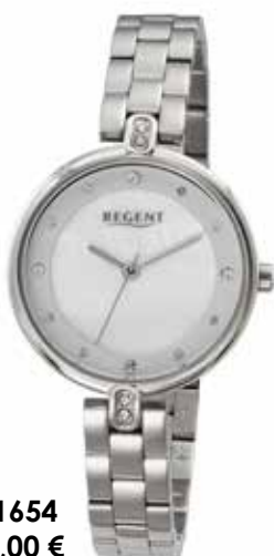
F-1654 99,00 €

Edelstahl + Edelstahl IPG, 5 Bar, Ø 30 mm, DruckfaltschlieÙe