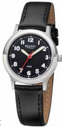
F-1071 49,90 €