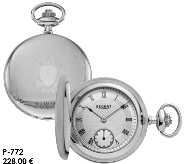
P-772 228,00 €