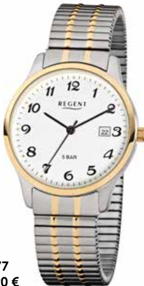
F-877 79,90 €