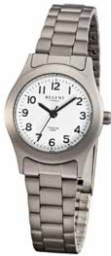
F-855 59,90 €