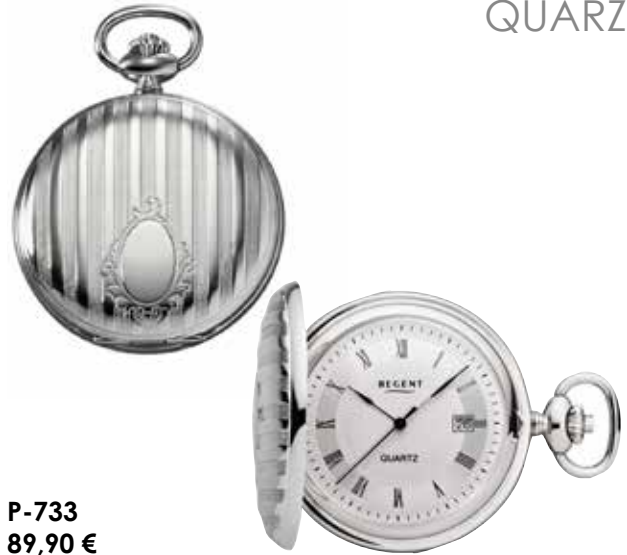
P-733 89,90 €