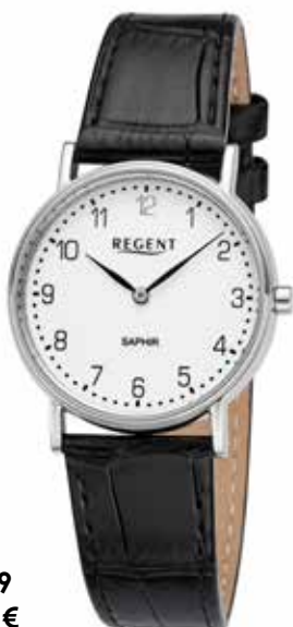
F-1429 89,90 €

Edelstahl + Edelstahl IPG, Saphir, 3 Bar, Ø 32 mm