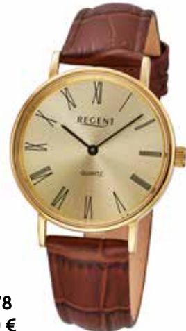
F-1578 79,90 €

Edelstahl + Edelstahl IPG, 3 Bar, Ø 32 mm