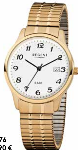
F-876 79,90 €

Edelstahl + Edelstahl IPG, 5 Bar, Ø 36 mm