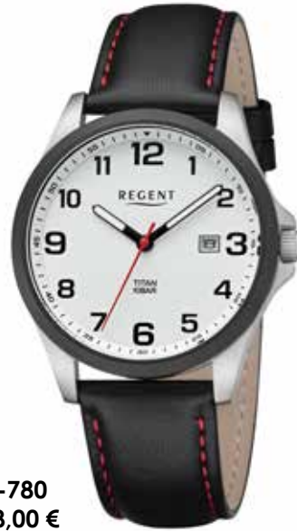
BA-780 118,00 €