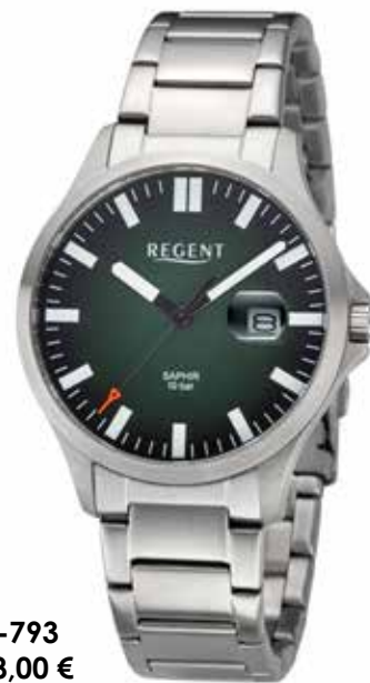
BA-793 118,00 €

Edelstahl, Saphir, 10 Bar, Ø 40 mm, DruckfallschlieÙe