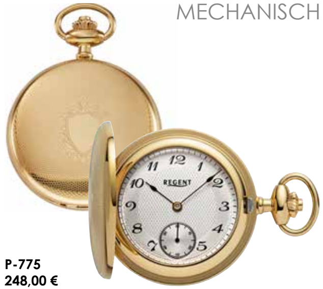
P-775 248,00 €