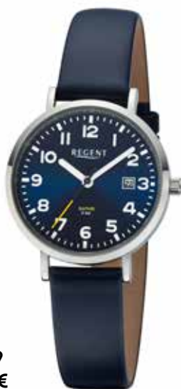
F-1629 99,00 €