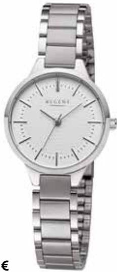
F-1502 118,00 €