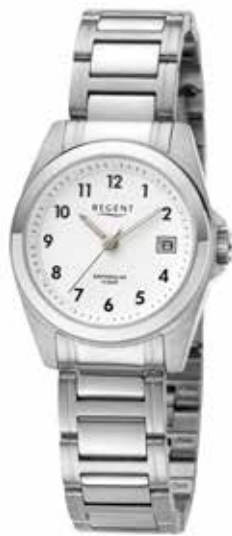
F-1593 89,90 €