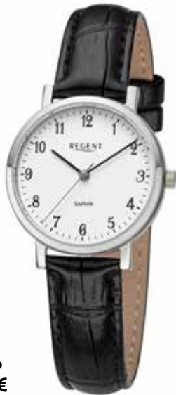
F-1426 79,90 €

Edelstahl + Edelstahl IPG, 5 Bar, Ø 28 mm