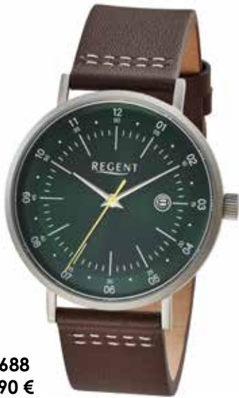
F-1688 89,90 €