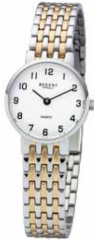
F-1158 99,00 €