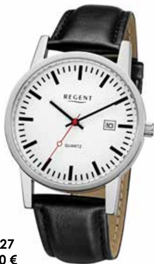
F-1027 59,90 €

Edelstahl + Edelstahl IPG, Saphir, 5 Bar, Ø 39 mm