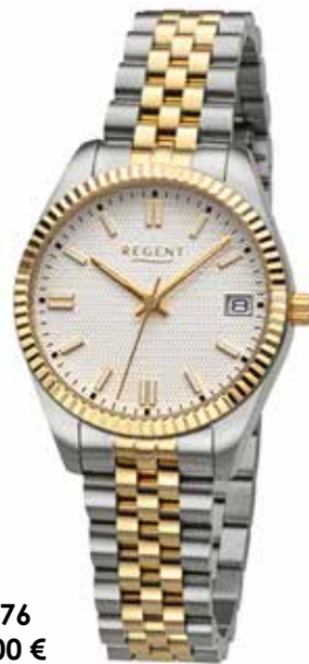
BA-876 148,00 €

Edelstahl + Edelstahl IPG, 10 Bar, Ø 34 mm, DruckfaltschlieÙe