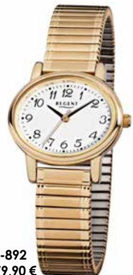
F-892 79,90 €

Edelstahl + Edelstahl IPG, 3 Bar, 28 x 32 mm