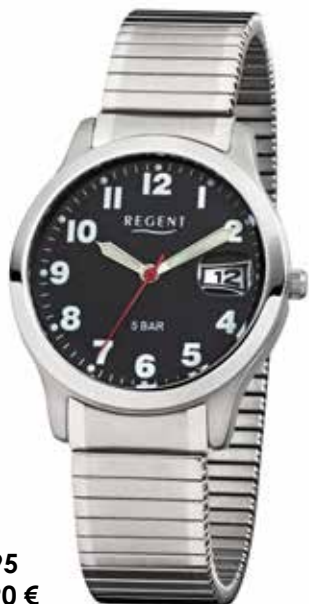
F-895 69,90 €

Edelstahl IPG, 5 Bar, Ø 37 + 28 mm, extra deutlich