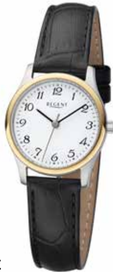
F-1250 69,90 €