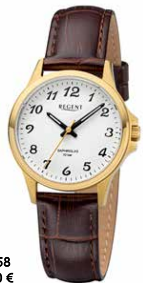
F-1458 79,90 €

Edelstahl + Edelstahl IPG, Saphir, 10 Bar, Ø 32 mm