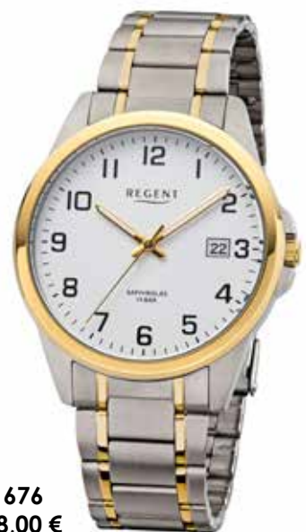
F-1676 128,00 €

Titan + Titan IPG, Saphir, 10 Bar, Ø 40 mm, Sicherheits-Faltverschluss