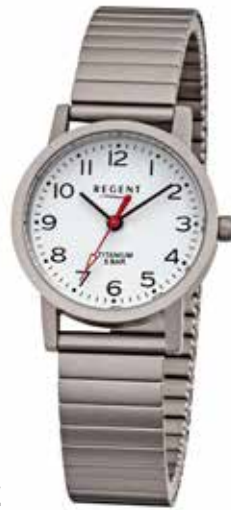
F-1435 79,90 €