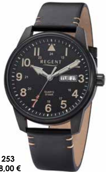
F-1253 118,00 €

Edelstahl + Edelstahl IPB, 20 Bar, Ø 41 mm, Datum mit Wochentag