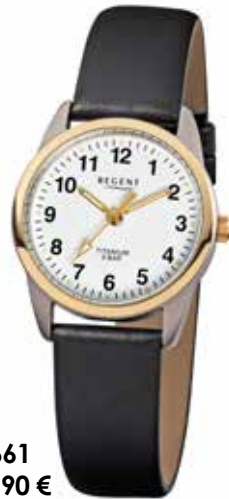
F-661 59,90 €