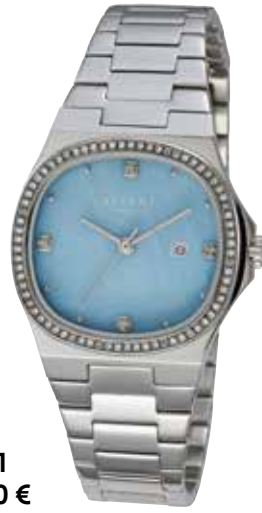
F-1601 148,00 €

Edelstahl, 5 Bar, Ø 30 mm, DruckfaltschlieÙe