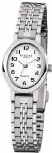
F-1169 59,90 €

Edelstahl + Edelstahl IPG, 3 Bar, Ø 19mm, DruckfaltschlieÙe