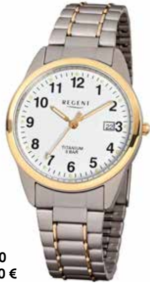
F-430 79,90 €