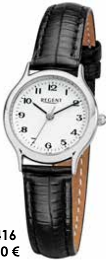
F-1416 79,90 €

Edelstahl + Edelstahl IPG, 3 Bar, 18 x 21 mm