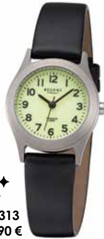
◆◆◆ F-1313 49,90 €