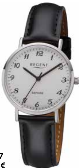
F-1217 89,90 €

Edelstahl + Edelstahl IPG, 3 Bar, Ø 32 mm