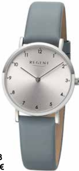
F-1638 79,90 €

Edelstahl + Edelstahl IPG, 3 Bar, Ø 28 mm