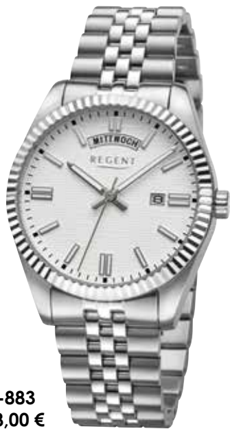
BA-883 148,00 €