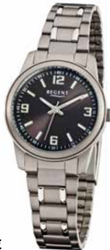
F-858 69,90 €