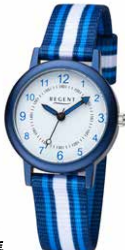
F-1369 44,90 €