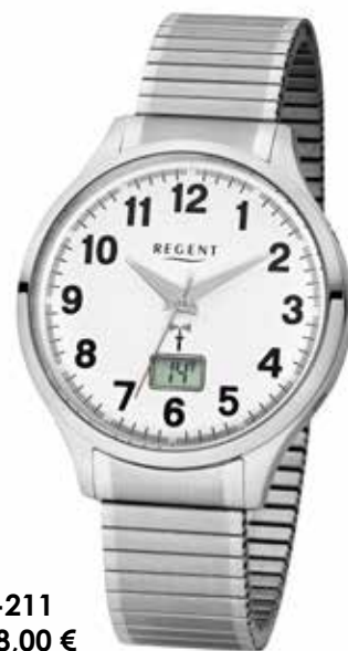
FR-211 148,00 €

Edelstahl + Edelstahl IPG, 5 Bar, Ø 40 mm, DruckfaltschlieÙe