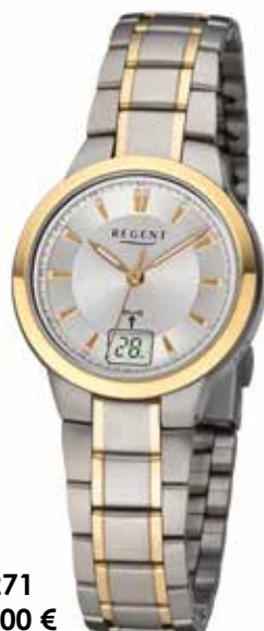
FR-271 188,00 €

Titan + Titan IPG, 5 Bar, Ø 30 mm, DruckfallschlieÙe