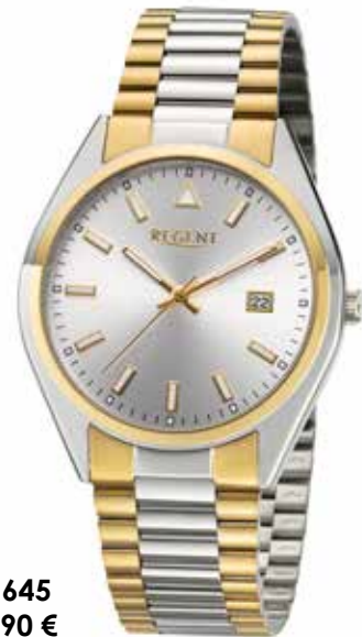
F-1645 89,90 €

Edelstahl + Edelstahl IPG, 5 Bar, Ø 39 mm, DruckfaltschlieÙe