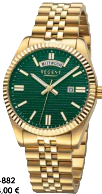
BA-882 158,00 €