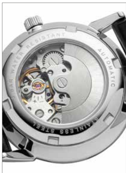
GM-2206 288,00 €

Eine Automatikuhr ist ein Wunderwerk der Mechanik, das durch die bloße Bewegung ihres Trägers angetrieben wird und keine Batterie benötigt. Ein im Gehäuse verbauter Rotor, eine sogenannte Schwungmasse, dreht sich bei jeder Handbewegung und zieht so eine feine Feder im Uhrwerk auf. Die in dieser Feder gespeicherte kinetische Energie treibt die Zeiger an und lässt die Uhr präzise laufen.