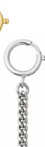
P-47 16,00 €

vergoldet + vernickelt, Rundpanzer, 5 mm