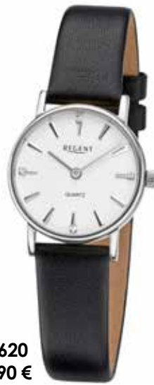
F-1620 89,90 €