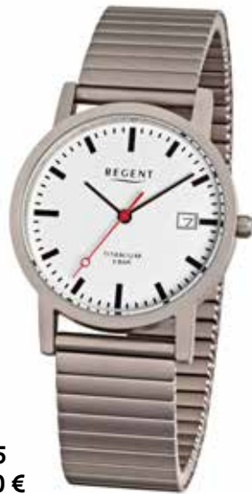
F-475 89,90 €