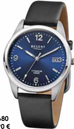
F-1680 64,90 €