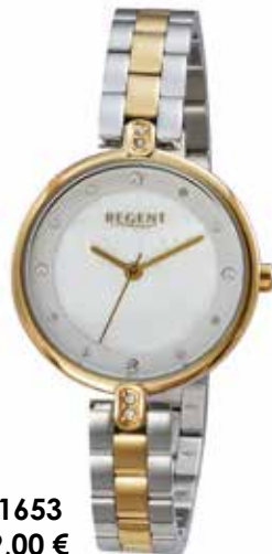
F-1653 99,00 €