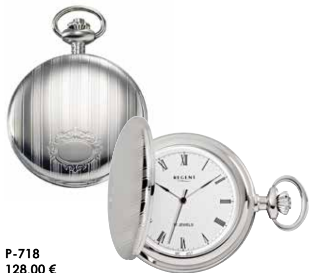
P-718 128,00 €