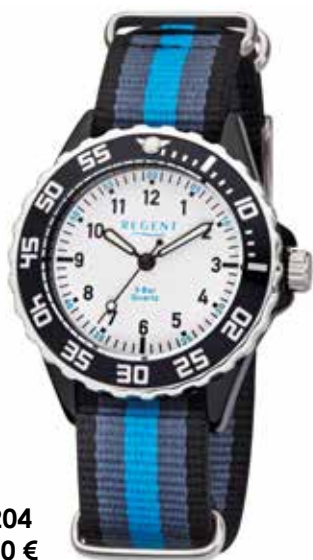
F-1204 39,90 €