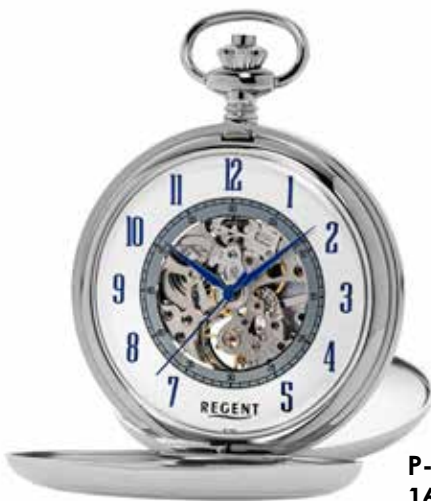
P-705 168,00 €