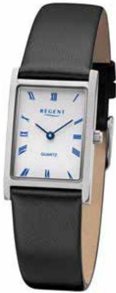
F-1300 89,90 €