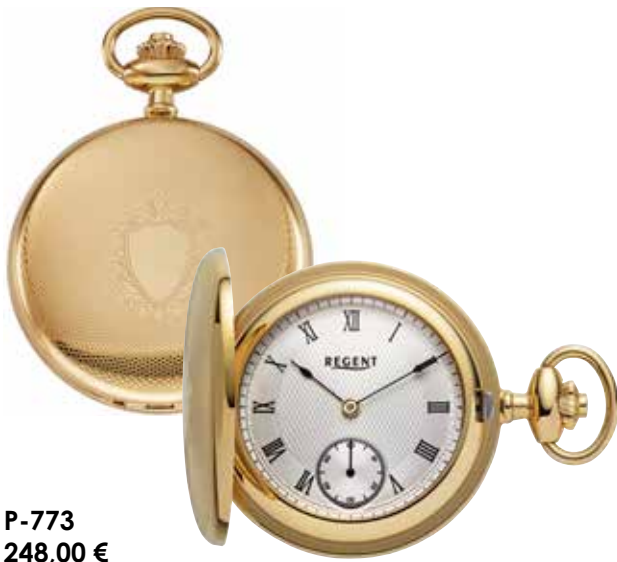
P-773 248,00 €