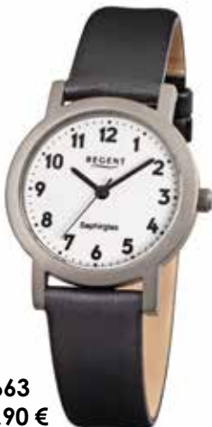
F-663 89,90 €