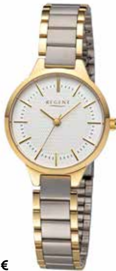
F-1503 138,00 €