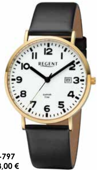
BA-797 118,00 €

Edelstahl + Edelstahl IPG, Saphir, 5 Bar, Ø 39 mm