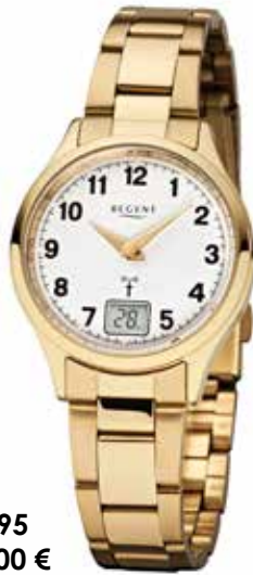
FR-195 158,00 €