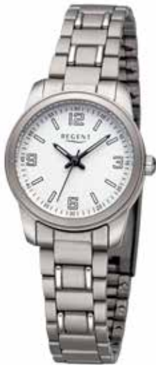
F-1441 69,90 €