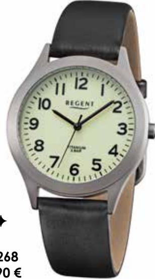
◆◆◆ F-1268 49,90 €