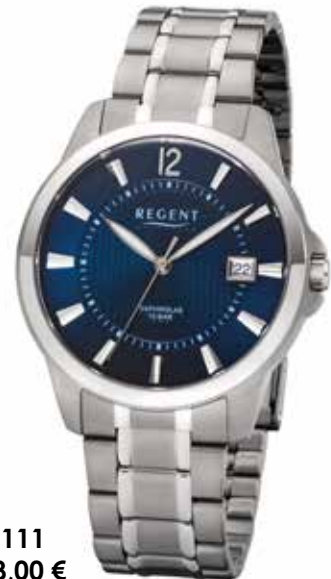
F-1111 118,00 €