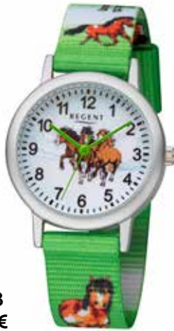
F-1363 44,90 €