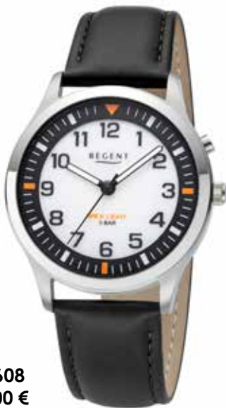
F-1608 99,00 €

Edelstahl, 5 Bar, Ø 38 mm, Hintergrundbeleuchtung (sh. BA-774), DruckfallschlieÙe