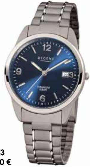
F-433 69,90 €