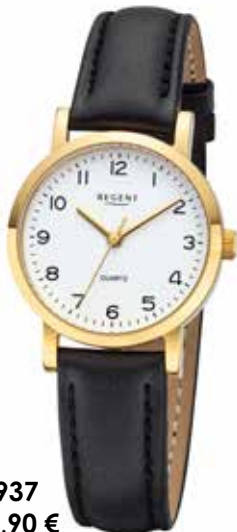
F-937 59,90 €