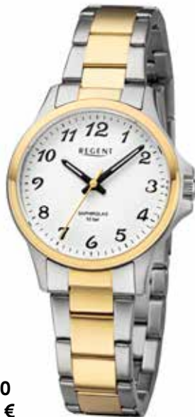
F-1460 99,00 €