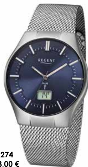
FR-274 168,00 €