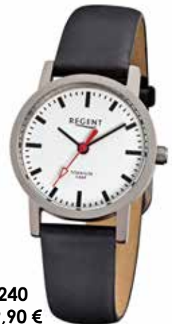
F-240 59,90 €