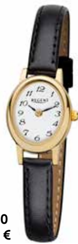
F-1410 89,90 €

Edelstahl + Edelstahl IPG, 3 Bar, Ø 20 mm