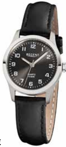
F-900 59,90 €