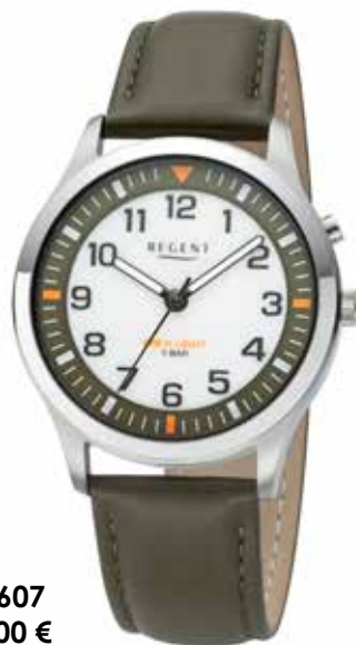
F-1607 99,00 €

Edelstahl, 5 Bar, Ø 39 mm, Hintergrundbeleuchtung