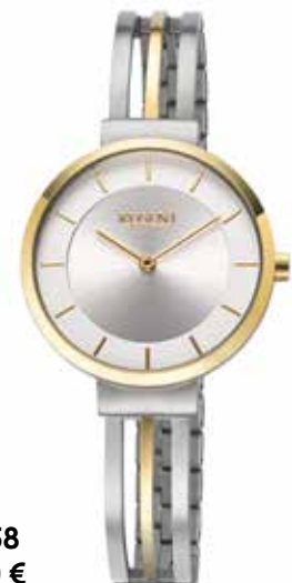
F-1658 99,00 €