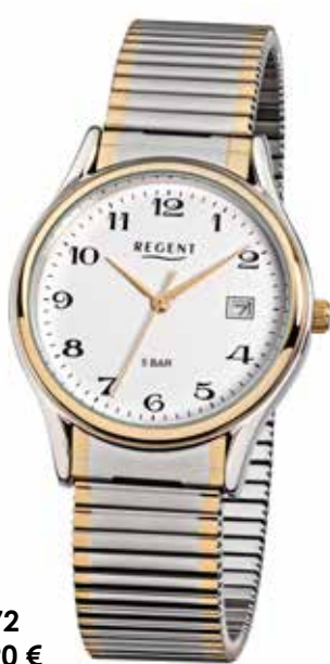
F-472 69,90 €