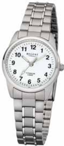
F-1085 69,90 €