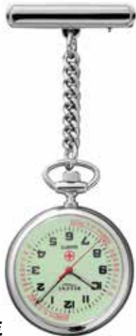
P-757 59,90 €