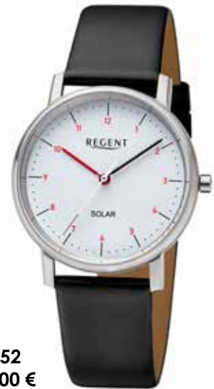
F-1552 128,00 €