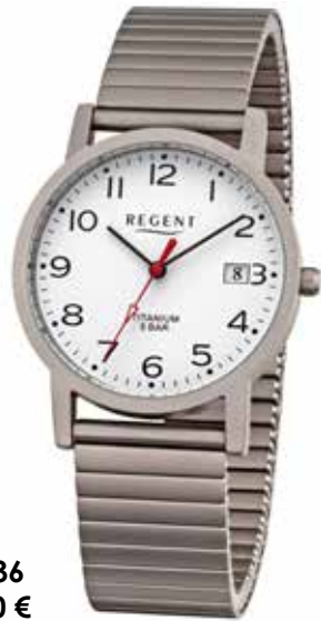
F-1436 89,90 €