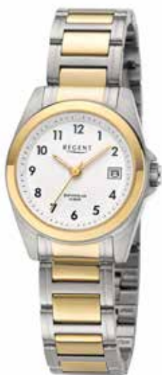
F-1596 99,00 €

Edelstahl, Saphir, 10 Bar, Ø 27 mm, Sicherheits-FaltschlieÙe