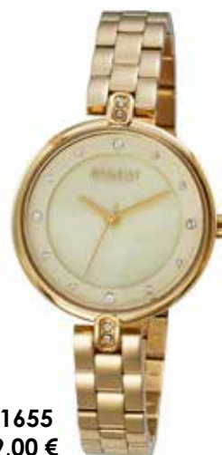
F-1655 99,00 €

Edelstahl + Edelstahl IPG, 3 Bar, Ø 30 mm