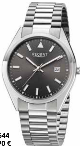
F-1644 79,90 €

Edelstahl + Edelstahl IPG, Saphir, 10 Bar, Ø 38 mm, Datum mit Wochentag