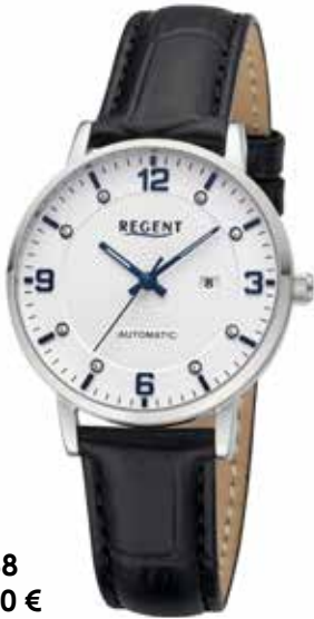
F-1668 178,00 €