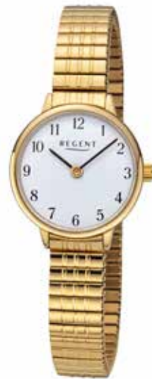
F-1511 89,90 €

Edelstahl + Edelstahl IPG, 3 Bar, Ø 25 mm