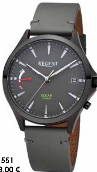
F-1551 168,00 €

Edelstahl + Edelstahl IPB, 10 Bar, Ø 41 mm