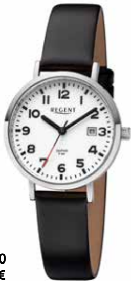
BA-790 99,00 €

Edelstahl + Edelstahl IPG, 5 Bar, Ø 28 mm, extra deutlich