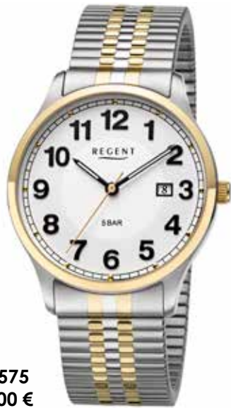
F-1575 99,00 €