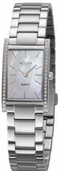
BA-865 178,00 €

Edelstahl IPG, 5 Bar, Ø 30 mm, DruckfaltschlieÙe