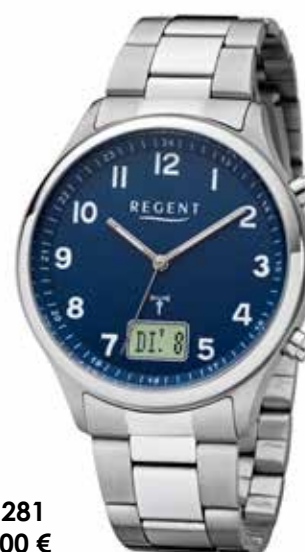
FR-281 99,00 €

Edelstahl, 5 Bar, Ø 39 mm, DruckfallschlieÙe