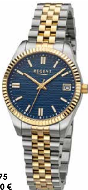
BA-875 148,00 €

Edelstahl + Edelstahl IPG, 10 Bar, Ø 34 mm, DruckfaltschlieÙe