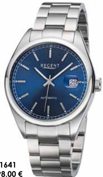
F-1641 198,00 €

Edelstahl, Automatik, 10 Bar, Ø 41 mm, DruckfallschlieÙe