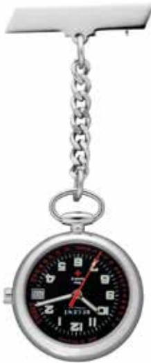
P-753 89,90 €