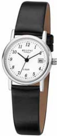
F-827 49,90 €