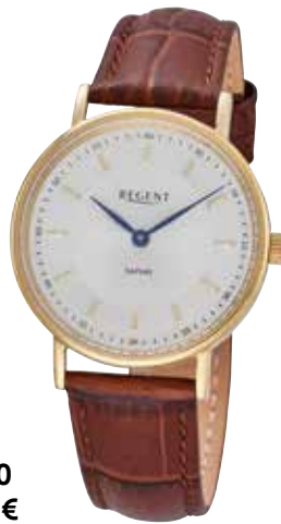
F-1580 89,90 €

Edelstahl + Edelstahl IPG, Saphir, 3 Bar, Ø 32 mm