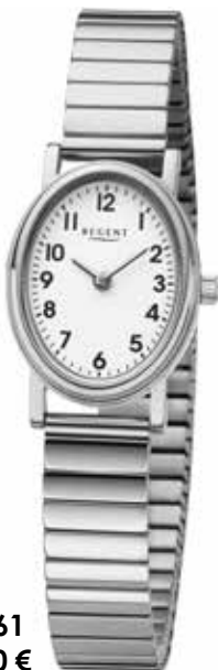
F-1361 69,90 €

Edelstahl + Edelstahl IPG, 3 Bar, Ø 22 mm