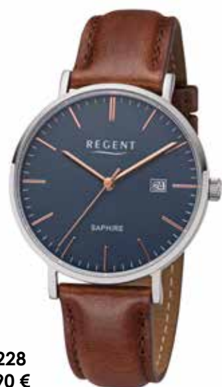
F-1228 89,90 €

Edelstahl + Edelstahl IPG, Saphir, 3 Bar, Ø 38 mm