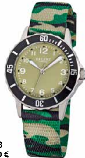
F-938 49,90 €