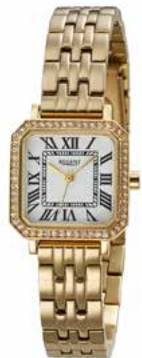
F-1648 99,00 €

Edelstahl + Edelstahl IPG, 3 Bar, 23 x 23 mm, DruckfallschlieÙe