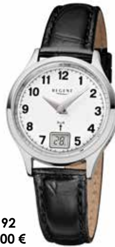
FR-192 138,00 €