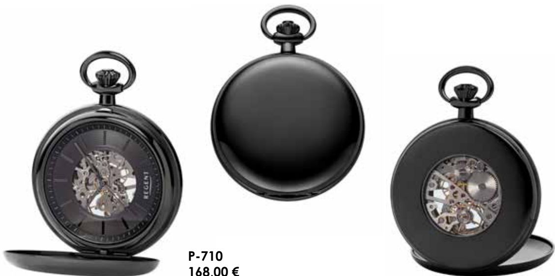
P-710 168,00 €

IP schwarz, Ø 51 mm, inkl. Kette IP schwarz