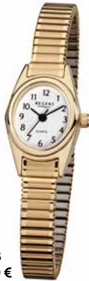
F-263 59,90 €

Edelstahl + Edelstahl IPG, 3 Bar, 19 x 21 mm