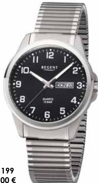
F-1199 99,00 €

Titan, 10 Bar, Ø 40 mm, Datum mit Wochentag