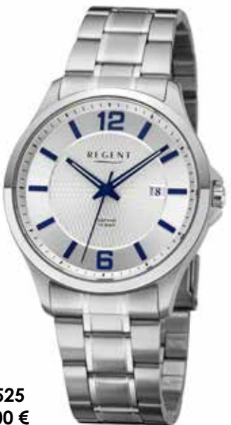
F-1525 99,00 €

Edelstahl und Edelstahl IPG, Saphir, 20 Bar, Ø 39 mm