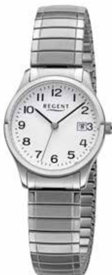
F-1512 69,90 €

Edelstahl + Edelstahl IPG, 3 Bar, Ø 27 mm