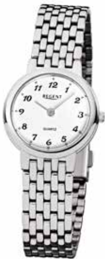
F-909 79,90 €

Edelstahl + Edelstahl IPG, 3 Bar, Ø 24 mm, DruckfaltschlieÙe