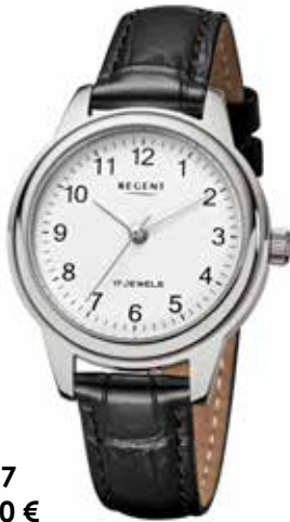
F-1567 138,00 €

Handaufzugsuhrn sind ebenfalls mechanische Uhren, die jedoch durch manuelles Drehen der Krone aufgezogen werden. Dabei spannt sich die Antriebsfeder im Inneren, wodurch die Uhr mit Energie versorgt wird. Im Gegensatz zu Automatikuhren, die sich durch Armbewegungen selbst aufziehen, erfordern Handaufzugsuhrn regelmaige Aufzuge.