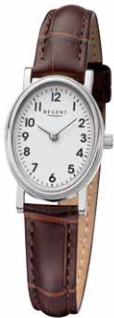
F-1305 69,90 €