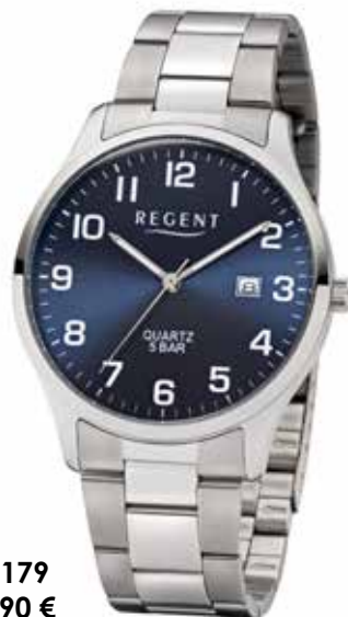
F-1179 59,90 €