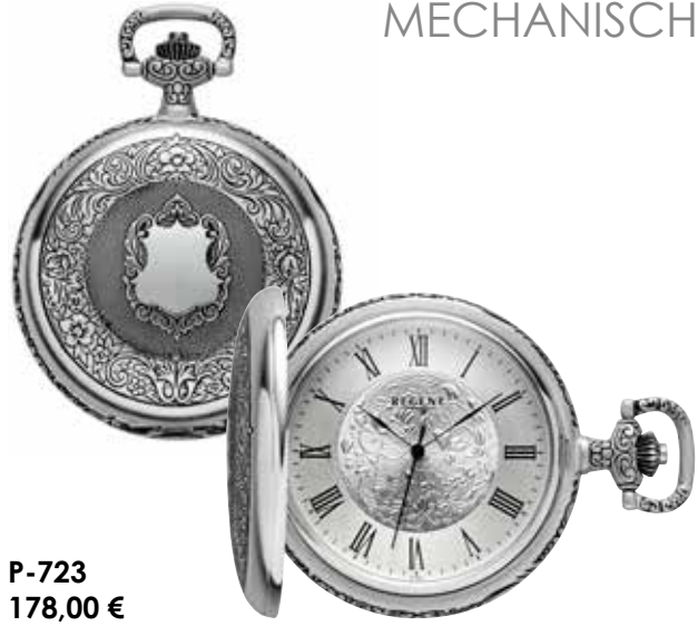
P-723 178,00 €