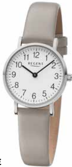
F-1303 79,90 €