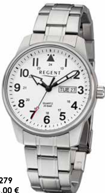
F-1279 118,00 €

Edelstahl, 5 Bar, Ø 40 mm, DruckfallschlieÙe, superflach