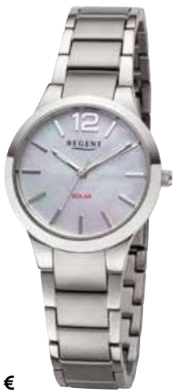
F-1534 198,00 €