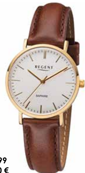
F-1299 99,00 €

Edelstahl + Edelstahl IPG, Saphir, 3 Bar, Ø 32 mm