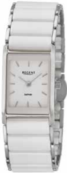
F-1581 188,00 €