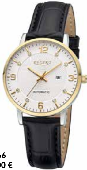
F-1666 188,00 €