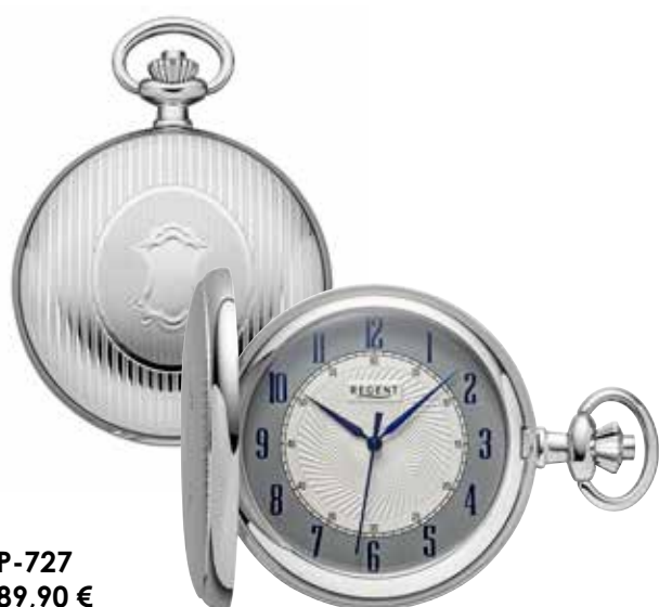
P-727 89,90 €