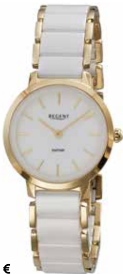
F-1626 198,00 €

Edelstahl/Keramik, Saphir, 3 Bar, Ø 30 mm, Butterfly-SchlieÙe