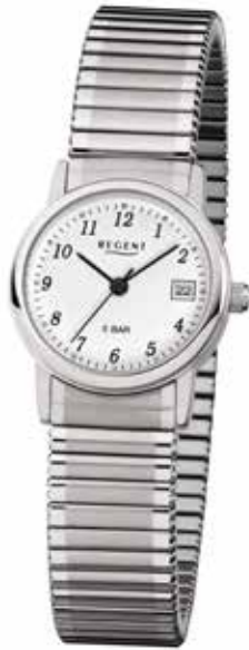
F-888 49,90 €