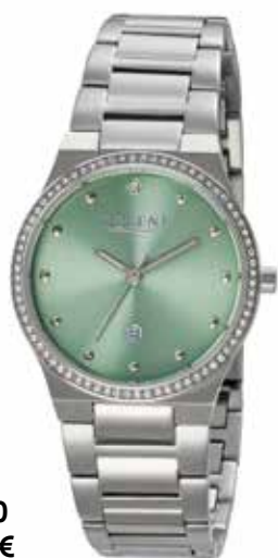
F-1660 99,00 €

Edelstahl + Edelstahl IPG, 3 Bar, Ø 19 mm