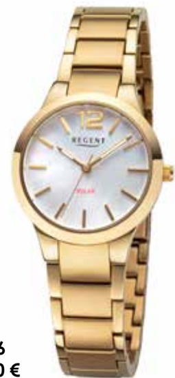
F-1536 218,00 €

Titan + Titan IPG, 5 Bar, Ø 30 mm, DruckfallschlieÙe