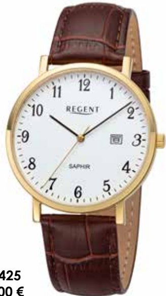
F-1425 99,00 €

Edelstahl + Edelstahl IPG, Saphir, 3 Bar, Ø 40 mm