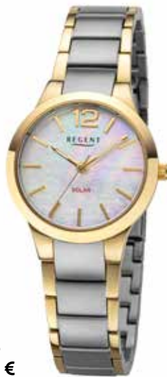
F-1683 218,00 €