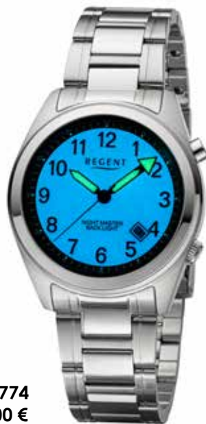
BA-774 99,00 €

Edelstahl, 5 Bar, Ø 38 mm, Hintergrundbeleuchtung (sh. BA-774), DruckfallschlieÙe