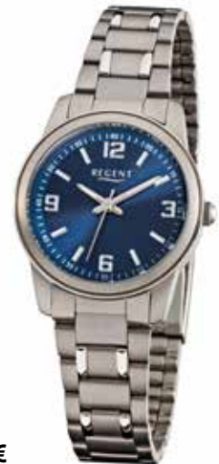
F-857 69,90 €