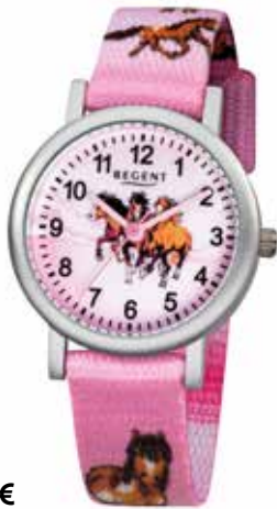
F-729 44,90 €