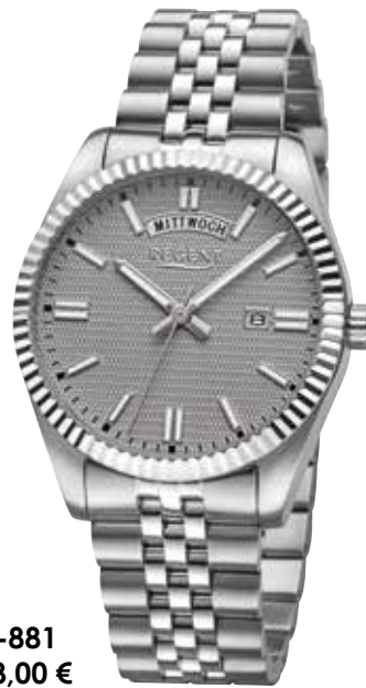
BA-881 148,00 €

Edelstahl, 10 Bar, Ø 40 mm, Druckfaltschließe