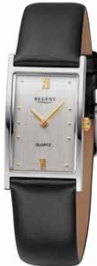
F-1508 118,00 €