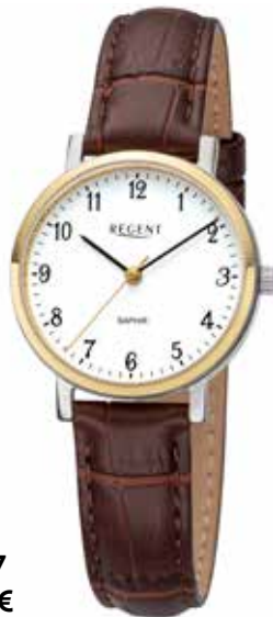
F-1427 89,90 €