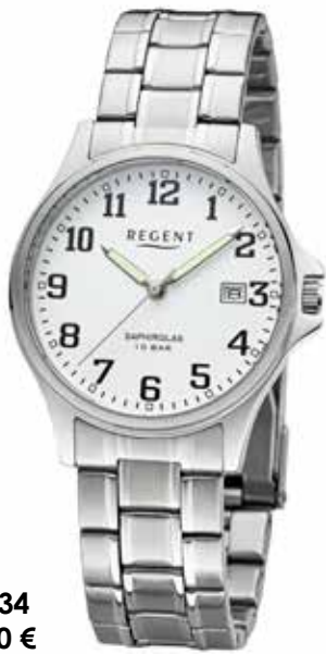
F-1434 79,90 €