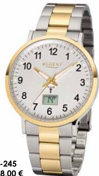
FR-245 148,00 €

Edelstahl + Edelstahl IPG, 3 Bar, Ø 40 mm