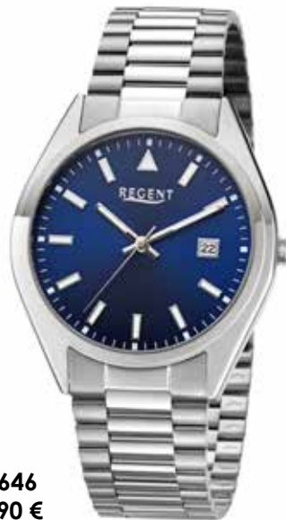
F-1646 79,90 €