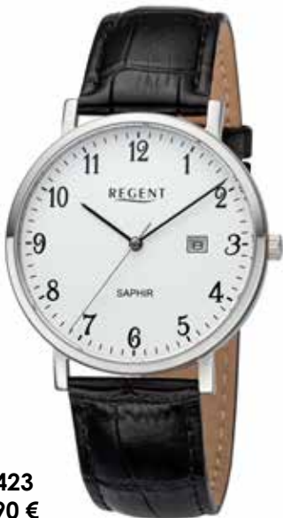
F-1423 89,90 €