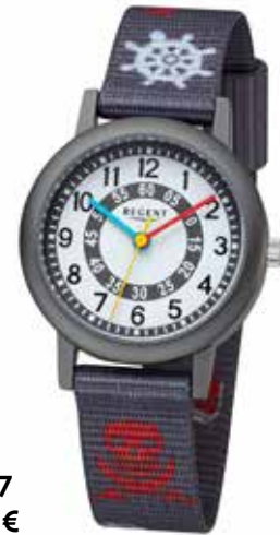
F-1367 44,90 €