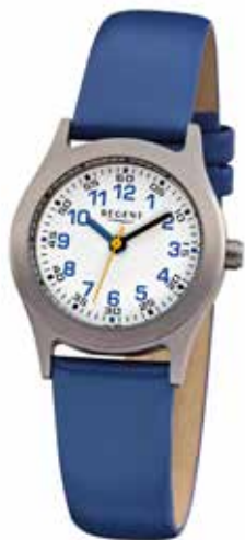
F-947 49,90 €