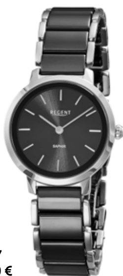
F-1627 188,00 €