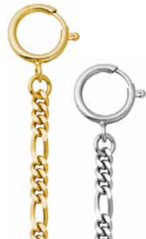
P-48 25,00 €

vergoldet + vernickelt, Figaro flach, 5 mm