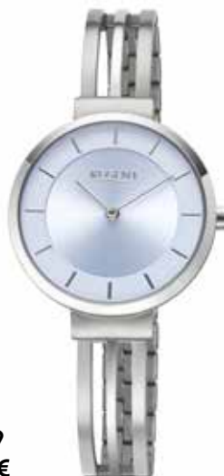
F-1659 89,90 €