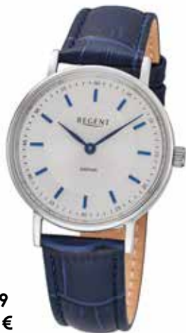
F-1579 89,90 €

Edelstahl + Edelstahl IPG, 3 Bar, 28 x 32 mm