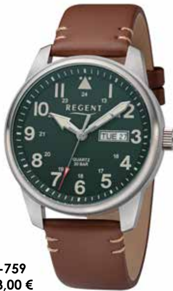
BA-759 118,00 €