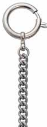
PS-05 24,00 €