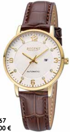
F-1667 188,00 €

Edelstahl + Edelstahl IPG, Automatik, 5 Bar, Ø 34 mm