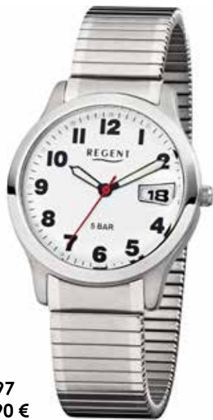
F-897 69,90 €