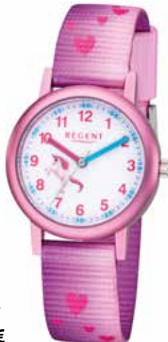
F-1207 44,90 €