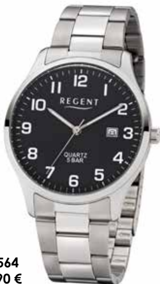
F-1564 59,90 €