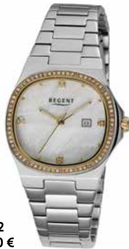
F-1602 158,00 €

Edelstahl, 5 Bar, Ø 30 mm, DruckfaltschlieÙe