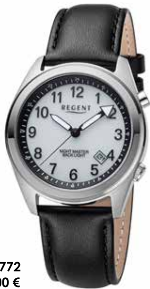
BA-772 99,00 €