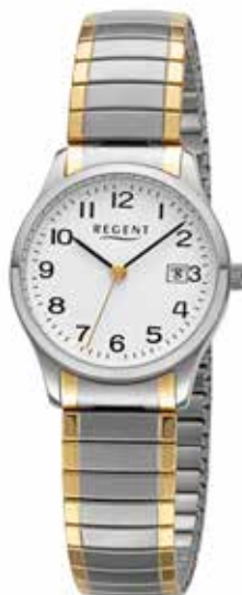
F-1514 79,90 €