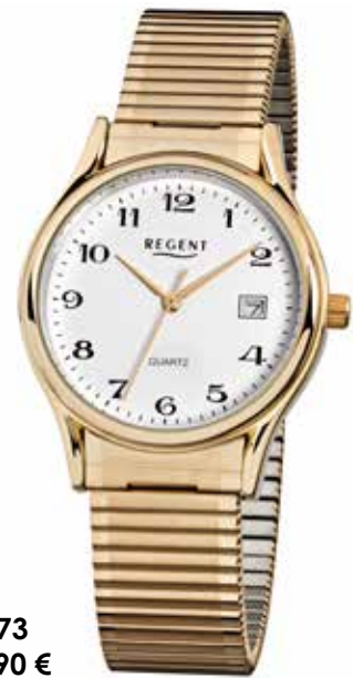
F-873 69,90 €

Edelstahl + Edelstahl IPG, 5 Bar, Ø 36 mm