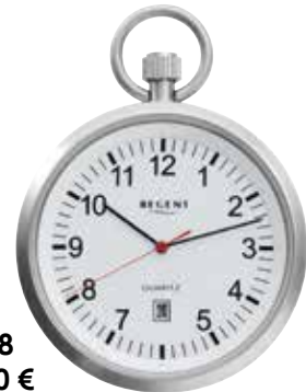
P-778 79,90 €