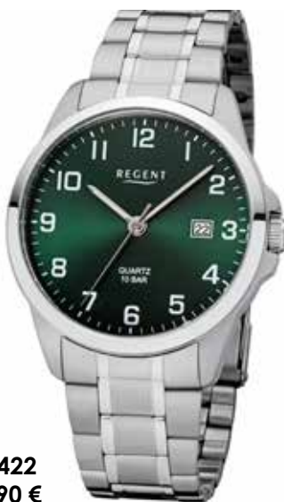
F-1422 59,90 €

Edelstahl und Edelstahl IPG, 10 Bar, Ø 39 mm