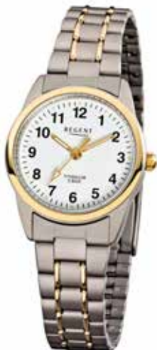
F-428 79,90 €