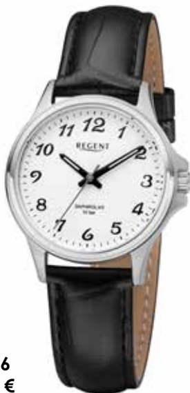
F-1456 69,90 €

Edelstahl + Edelstahl IPG, Saphir, 5 Bar, Ø 31 mm