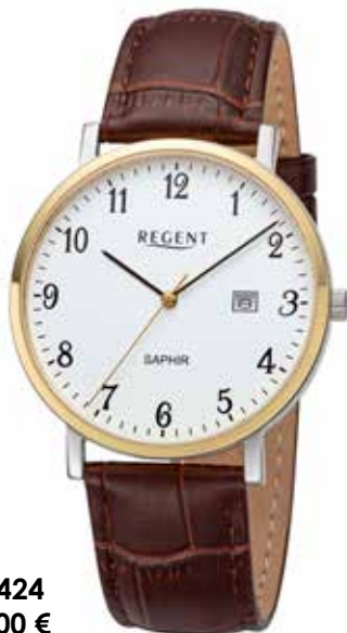
F-1424 99,00 €