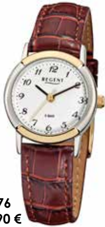
F-576 69,90 €