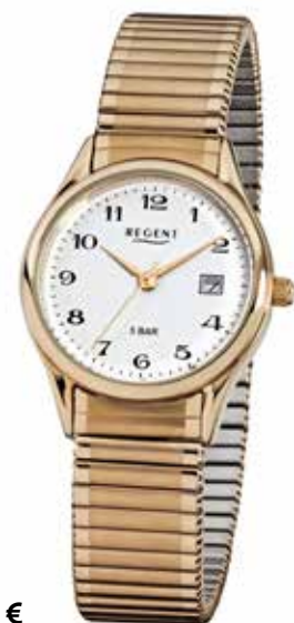
F-894 69,90 €

Edelstahl + Edelstahl IPG, 5 Bar, Ø 29 mm