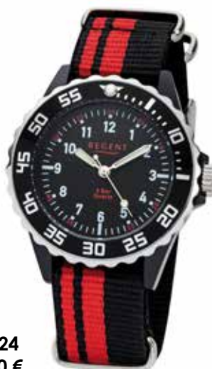
F-1124 39,90 €