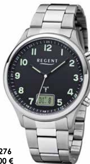
FR-276 99,00 €