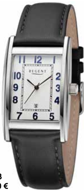
F-1518 118,00 €