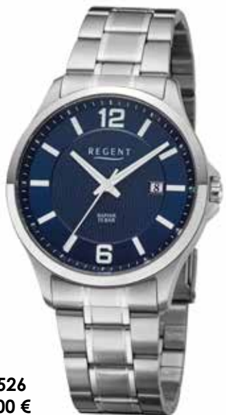
F-1526 99,00 €