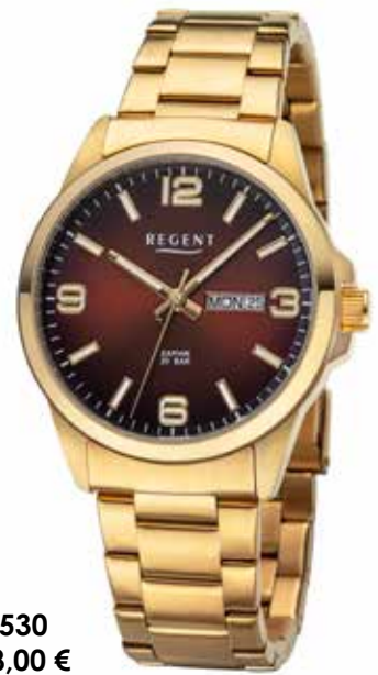
F-1530 128,00 €

Edelstahl und Edelstahl IPG, Saphir, 20 Bar, Ø 39 mm