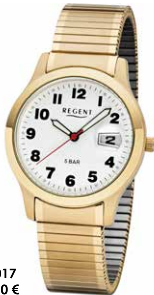
F-1017 79,90 €

Edelstahl, 5 Bar, Ø 37 + 28 mm, extra deutlich