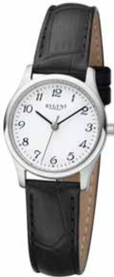
F-1249 59,90 €

Edelstahl + Edelstahl IPG, 5 Bar, Ø 25 mm