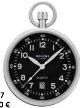
P-777 79,90 €