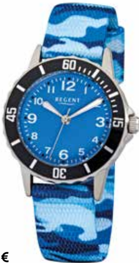
F-940 49,90 €