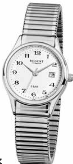
F-893 54,90 €

Edelstahl + Edelstahl IPG, 5 Bar, Ø 27 mm