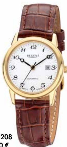
GM-2208 298,00 €