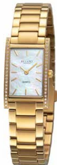
BA-867 188,00 €

Edelstahl + Edelstahl IPG, 5 Bar, 20 x 33 mm, DruckfaltschlieÙe