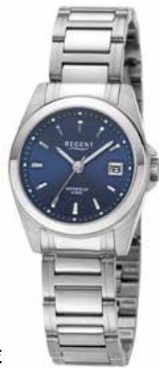
F-1594 89,90 €

Edelstahl, Saphir, 10 Bar, Ø 27 mm, Sicherheits-FaltschlieÙe