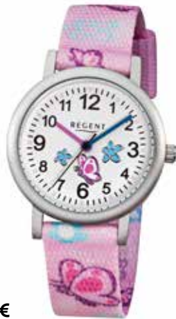
F-491 44,90 €