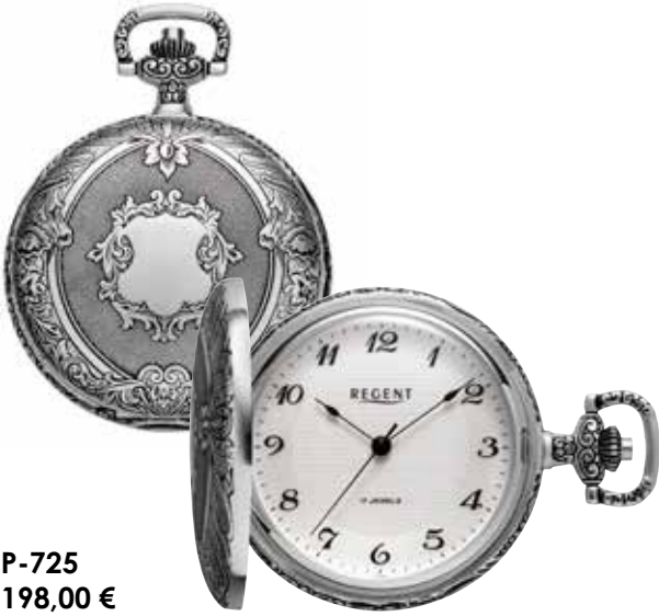
P-725 198,00 €