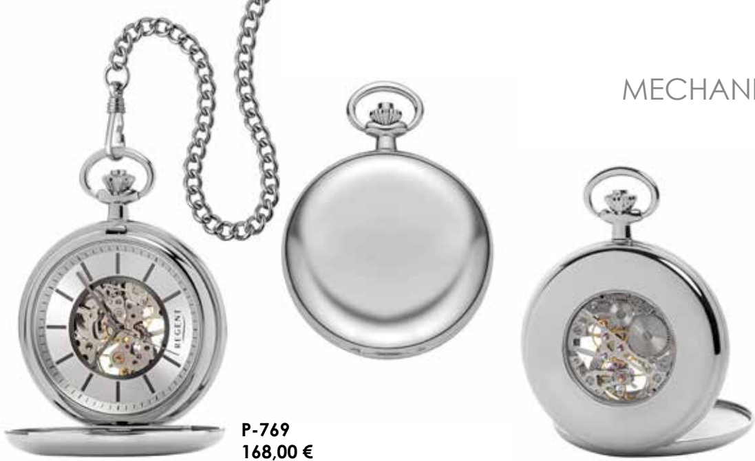
P-769 168,00 €