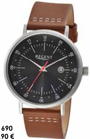
F-1690 89,90 €