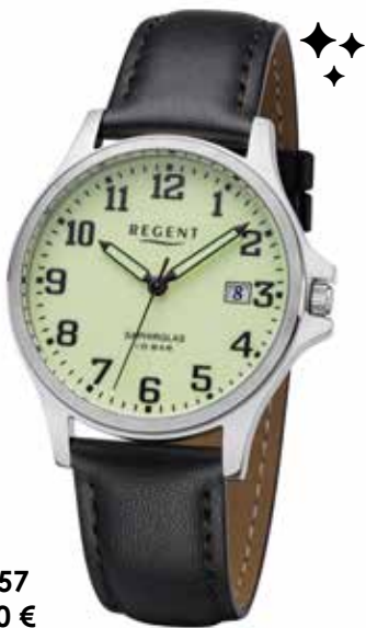
F-1257 69,90 €

Edelstahl + Edelstahl IPG, 5 Bar, 29 x 37 mm