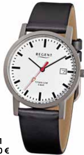
F-231 69,90 €