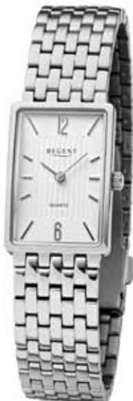
F-1343 128,00 €

Titan, 5 Bar, Ø 30 mm, DruckfallschlieÙe, superflach