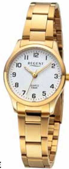
F-1421 69,90 €