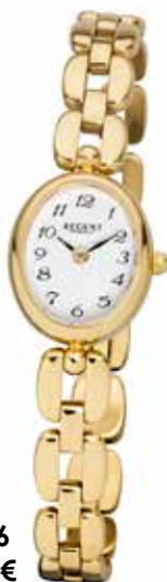
F-1406 99,00 €