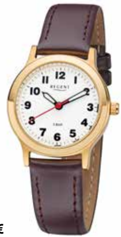
F-825 59,90 €

Edelstahl + Edelstahl IPG, 5 Bar, Ø 28 mm, extra deutlich