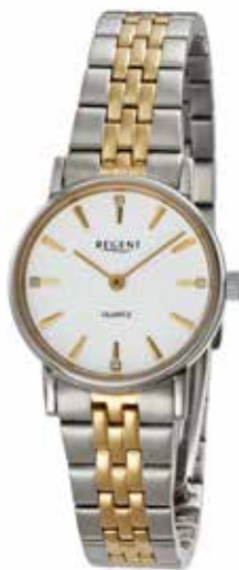
F-1623 99,00 €