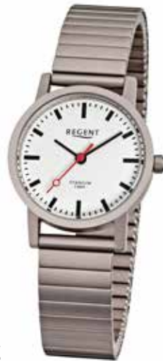
F-476 79,90 €