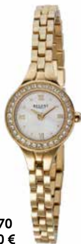
F-1670 99,00 €

Edelstahl + Edelstahl IPG, 3 Bar, Ø 19 mm