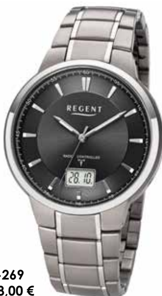
FR-269 178,00 €

Seit Anfang der 80er Jahre wird Titan als Werkstoff für Uhren genutzt. Die Leichtigkeit des Materials, seine hohe Belastbarkeit und seine hautverträglichen Eigenschaften machen Titan zu einem idealen Werkstoff für hochwertige und langlebige Uhren.