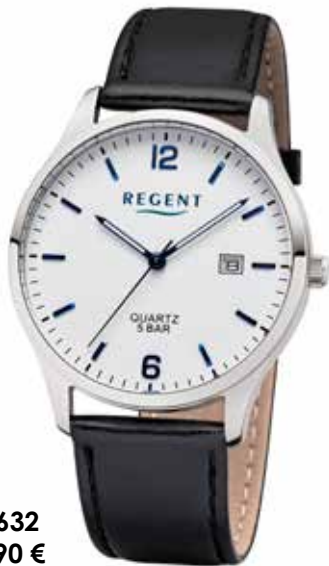
F-1632 59,90 €

REGENT- Beste Qualität zum besten Preis!