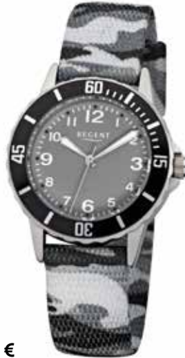
F-941 49,90 €