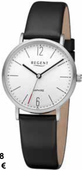
F-1318 99,00 €