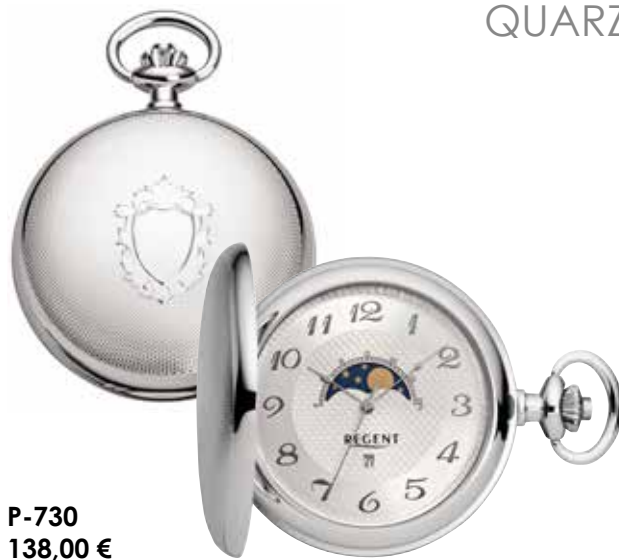
P-730 138,00 €