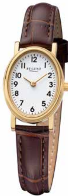
F-1306 79,90 €

Edelstahl + Edelstahl IPG, 3 Bar, 28 x 32 mm