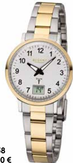
FR-258 148,00 €

Edelstahl + Edelstahl IPG, 3 Bar, Ø 30 mm