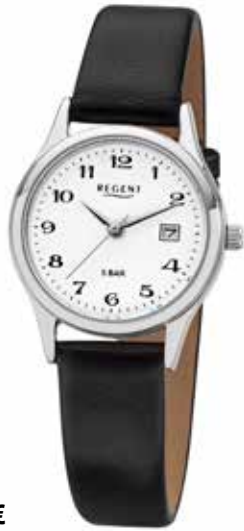
F-833 49,90 €