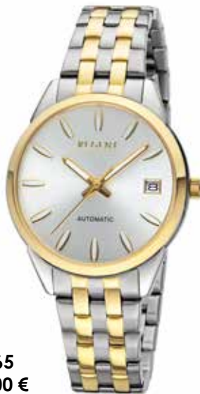
F-1665 198,00 €