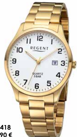
F-1418 69,90 €

Edelstahl + Edelstahl IPG, 5 Bar, Ø 39 mm