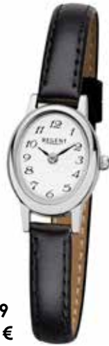
F-1409 79,90 €