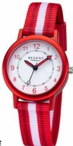
F-1370 44,90 €