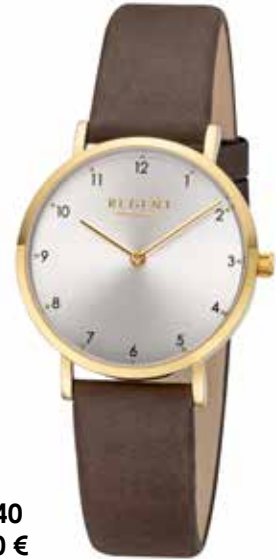
F-1640 89,90 €

Edelstahl + Edelstahl IPG, 3 Bar, Ø 32 mm