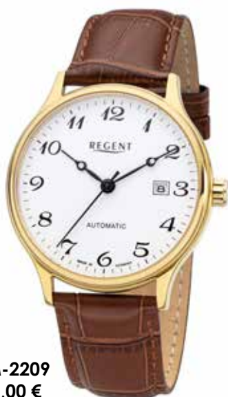
GM-2209 298,00 €

Edelstahl, Automatik, Saphir, 5 Bar, Ø 40 + 32 mm