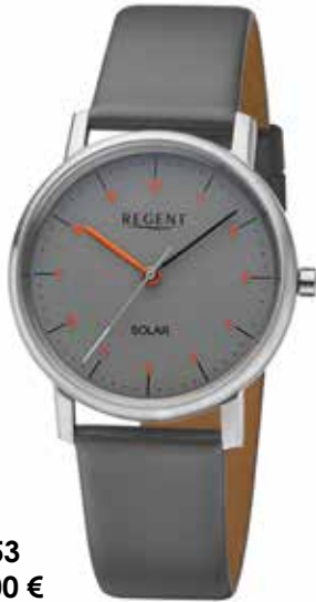
F-1553 128,00 €

Das Licht wird bei einer Solaruhr von lichtempfindlichen Solarzellen in Antriebsenergie umgewandelt und an das Quarzwerk weitergegeben. Daher sind Solaruhren umweltfreundlich und wirtschaftlich.