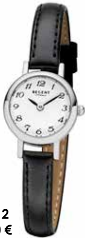
F-1412 79,90 €