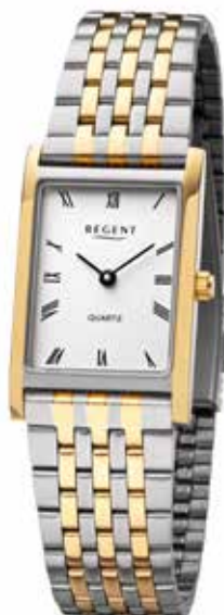
F-1332 99,00 €