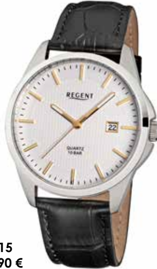
F-915 59,90 €