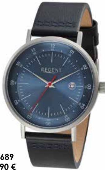
F-1689 89,90 €