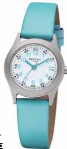
F-1119 49,90 €