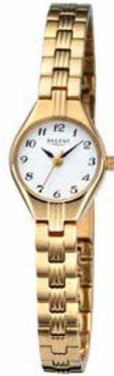
F-1470 118,00 €

Edelstahl + Edelstahl IPG, 3 Bar, Ø 19mm, DruckfaltschlieÙe