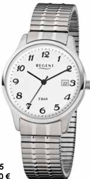
F-875 69,90 €

Edelstahl + Edelstahl IPG, 5 Bar, Ø 36 mm