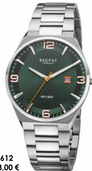
F-1612 138,00 €

Edelstahl, 5 Bar, Ø 40 mm, DruckfallschlieÙe, superflach