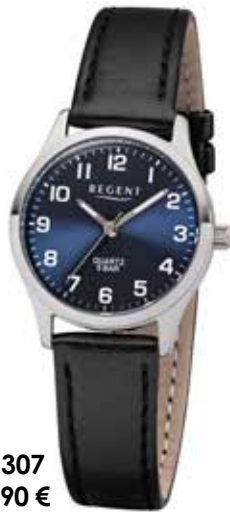
F-1307 59,90 €