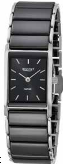
F-1583 188,00 €

Edelstahl/Keramik, Saphir, 3 Bar, 22 x 34 mm, Butterfly-SchlieÙe