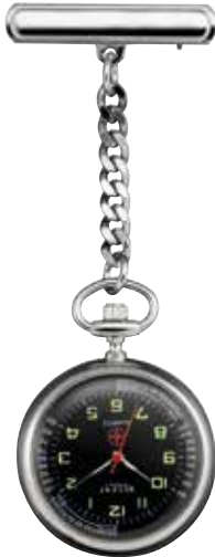
P-755 59,90 €