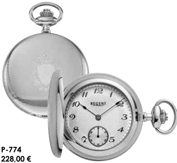
P-774 228,00 €