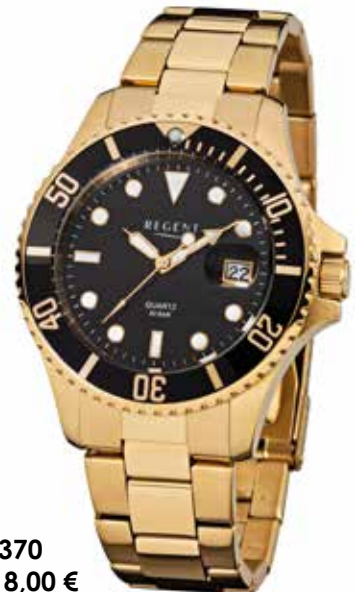
F-370 118,00 €

Edelstahl + Edelstahl IPG, 30 Bar, Ø 40 mm, verschraubte Krone