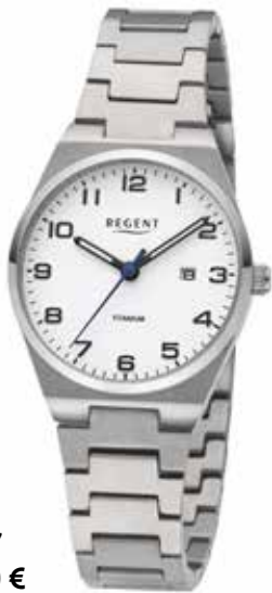
F-1617 128,00 €

Titan + Titan IPG, 5 Bar, Ø 28 mm, DruckfallschlieÙe