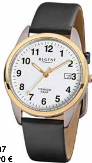
F-687 69,90 €