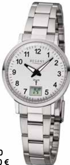
FR-260 138,00 €