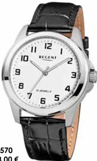
F-1570 138,00 €

Edelstahl + Edelstahl IPG, 5 Bar, Ø 32 mm, Handaufzug