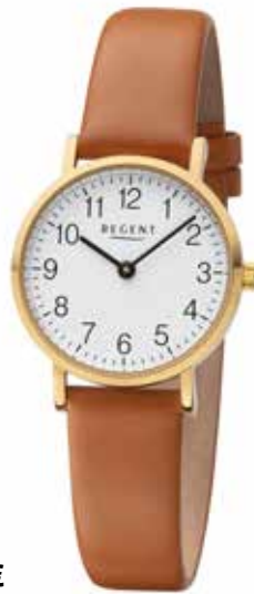
F-1304 89,90 €

Edelstahl + Edelstahl IPG, 3 Bar, Ø 28 mm