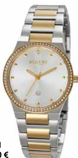
F-1661 118,00 €