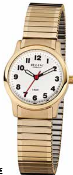
F-896 69,90 €

Edelstahl IPG, 5 Bar, Ø 37 + 28 mm, extra deutlich