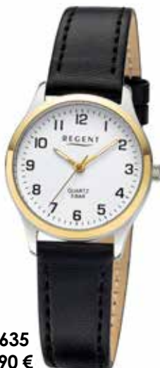
F-1635 59,90 €