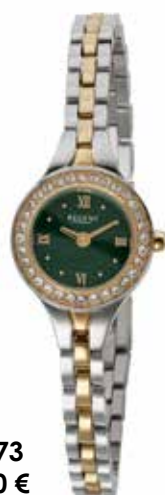
F-1673 99,00 €