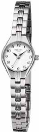
F-1468 99,00 €