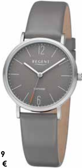
F-1319 99,00 €