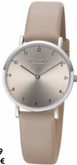
F-1639 79,90 €