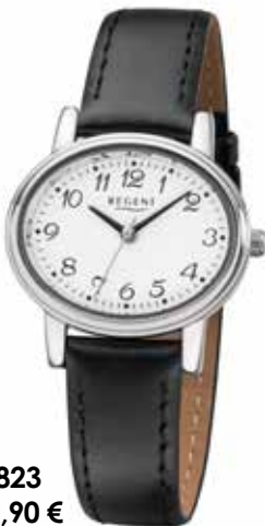
F-823 59,90 €

Edelstahl + Edelstahl IPG, 3 Bar, Ø 26 mm