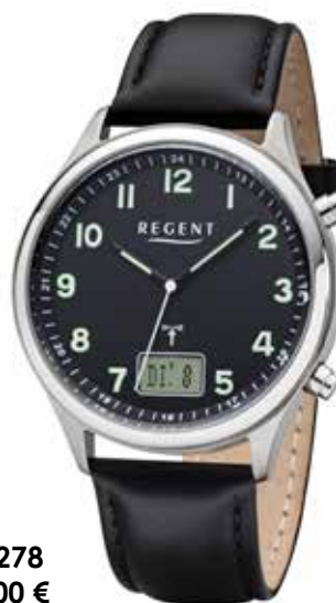
FR-278 99,00 €