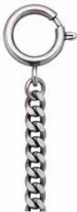
PS-02 25,00 €