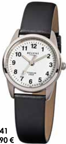
F-441 54,90 €