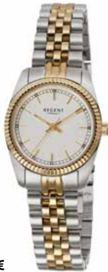
F-1598 128,00 €