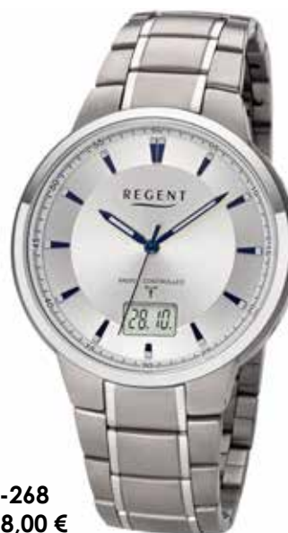
FR-268 178,00 €

Titan, 5 Bar, Ø 42 mm, DruckfaltschlieÙe