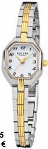
F-1685 69,90 €