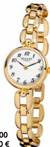
F-1400 99,00 €

Edelstahl + Edelstahl IPG, 3 Bar, 18 x 21 mm