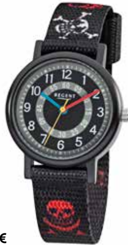
F-950 44,90 €