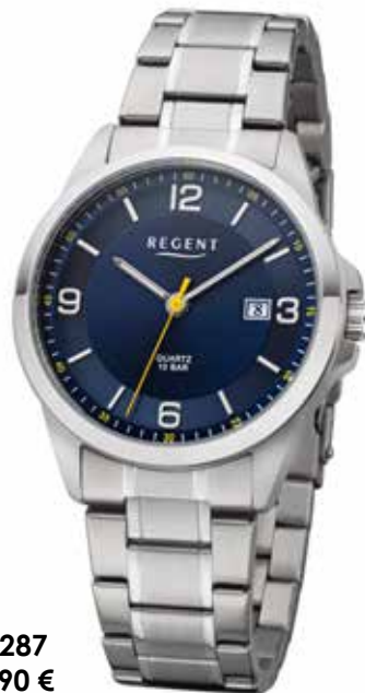
F-1287 89,90 €