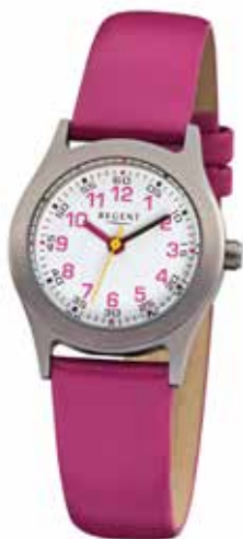
F-946 49,90 €