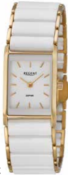
F-1582 198,00 €