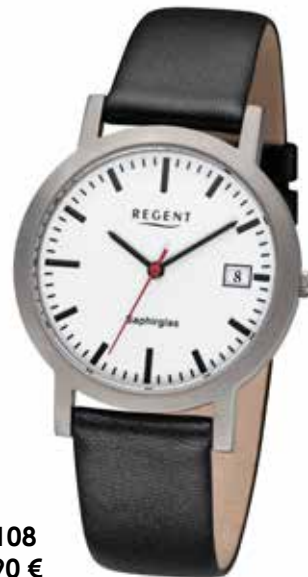
F-1108 89,90 €