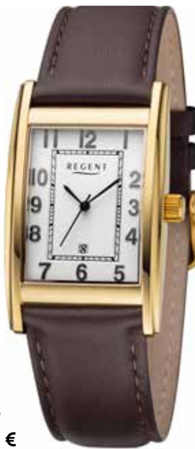
F-1519 128,00 €

Edelstahl + Edelstahl IPG, 5 Bar, 29 x 37 mm