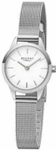
F-1165 69,90 €