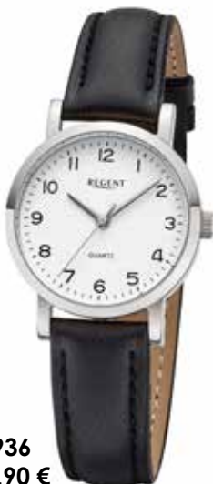
F-936 49,90 €

Edelstahl + Edelstahl IPG, 3 Bar, Ø 28 mm