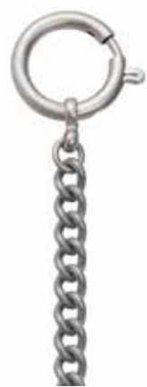
PS-06 24,00 €