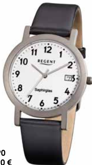
F-690 89,90 €