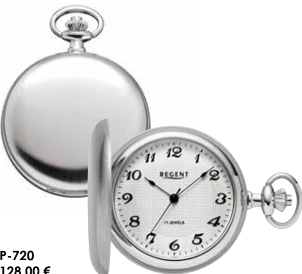
P-720 128,00 €