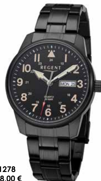
F-1278 128,00 €

Edelstahl + Edelstahl IPB, 20 Bar, Ø 41 mm, Datum mit Wochentag