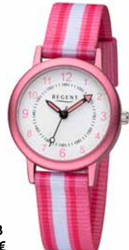
F-1368 44,90 €