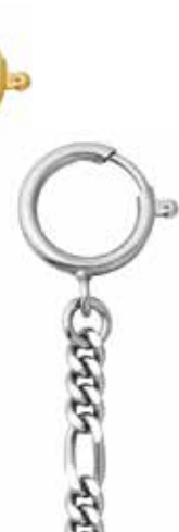
P-49 20,00 €

vergoldet + vernickelt, Figaro flach, 5 mm