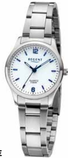
F-1419 59,90 €