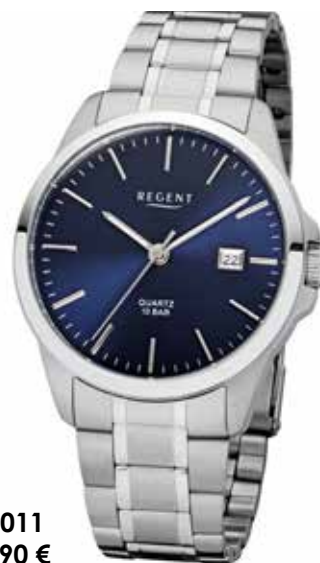
F-1011 59,90 €