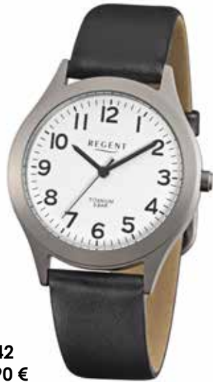
F-842 49,90 €

REGENT- Beste Qualität zum besten Preis!