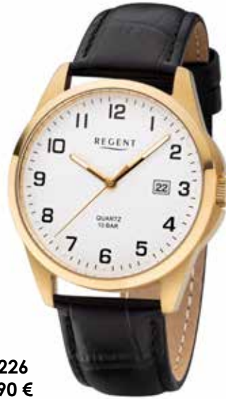
F-1226 69,90 €

Edelstahl + Edelstahl IPG, 10 Bar, Ø 39 mm