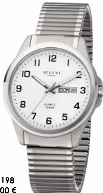
F-1198 99,00 €