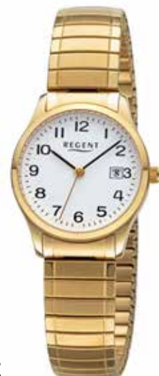
F-1513 79,90 €

Edelstahl + Edelstahl IPG, 5 Bar, Ø 27 mm