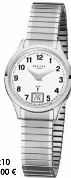
FR-210 158,00 €