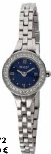
F-1672 89,90 €