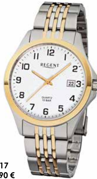
F-917 89,90 €

Edelstahl und Edelstahl IPG, 10 Bar, Ø 39 mm