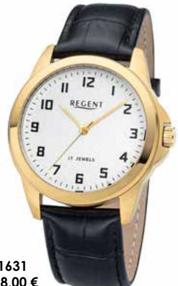
F-1631 148,00 €

Edelstahl + Edelstahl IPG, 5 Bar, Ø 39 mm, Handaufzug