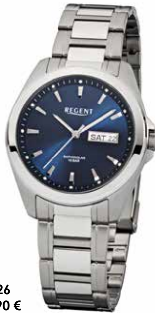
F-526 89,90 €

Edelstahl, Saphir, 10 Bar, Ø 38 mm, Datum mit Wochentag