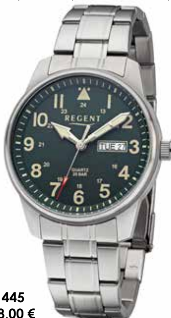
F-1445 118,00 €