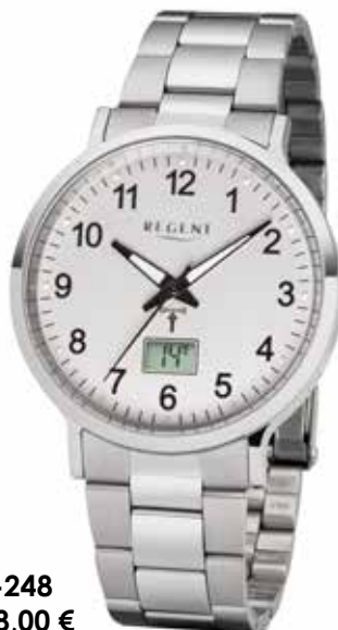
FR-248 138,00 €