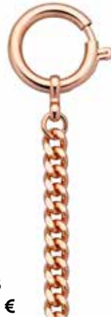
PS-03 29,00 €

Wir haben für jede Taschenuhr die passende Kette!