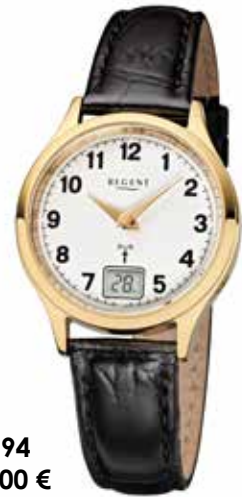
FR-194 148,00 €

Edelstahl + Edelstahl IPG, 5 Bar, Ø 29 mm