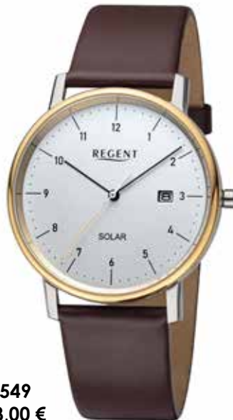
F-1549 158,00 €

Edelstahl IPB + Edelstahl IPG, 3 Bar, Ø 39 mm