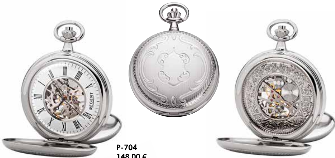
P-704 148,00 €