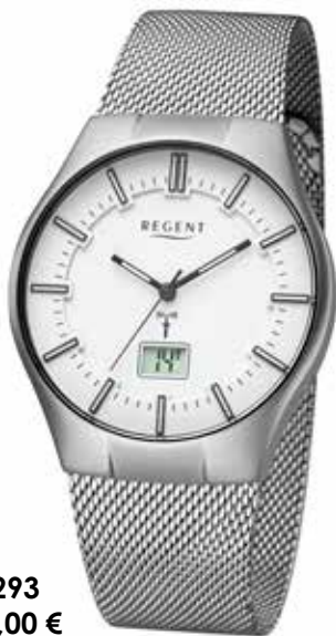
FR-293 168,00 €