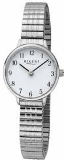
F-1510 79,90 €