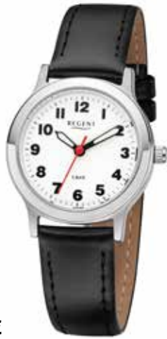
F-826 49,90 €