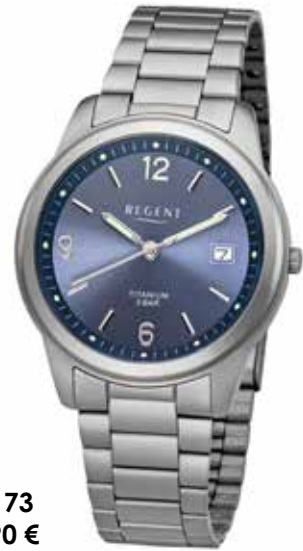
F-1173 69,90 €