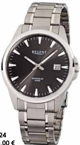
F-924 118,00 €

Titan, 10 Bar, Ø 40 mm, DruchfaltschlieÙe