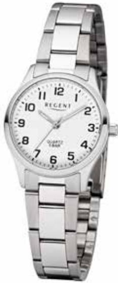
F-1327 59,90 €