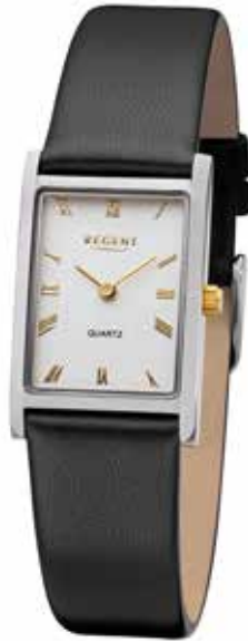
F-1301 89,90 €