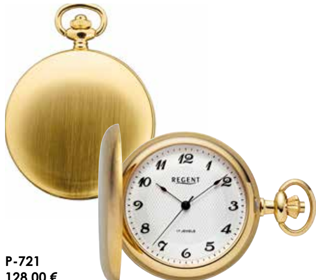
P-721 128,00 €