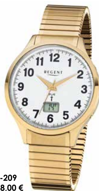
FR-209 158,00 €

Edelstahl + Edelstahl IPG, 5 Bar, Ø 40 mm, Zugband