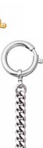
P-43 18,00 €

vergoldet + vernickelt, Flachpanzer, 6 mm