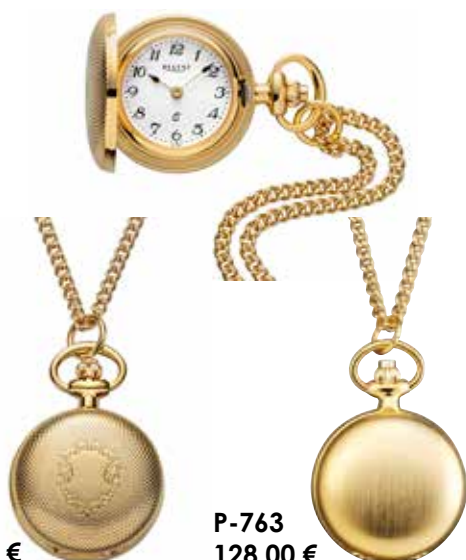
P-762 128,00 €