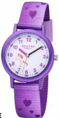
F-1365 44,90 €