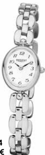
F-1404 89,90 €

Edelstahl + Edelstahl IPG, 3 Bar, 20x24 mm, DruckfaltschlieÙe