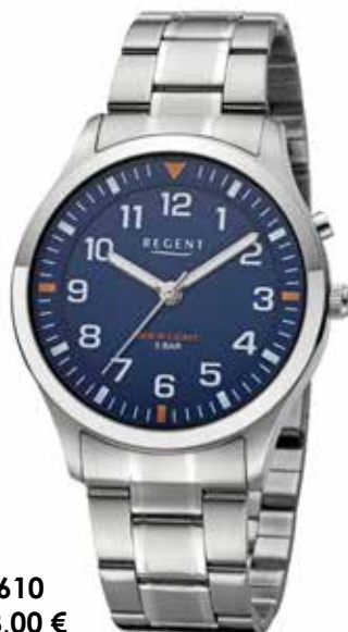
F-1610 118,00 €

Edelstahl, 5 Bar, Ø 39 mm, Hintergrundbeleuchtung, DruckfallschlieÙe