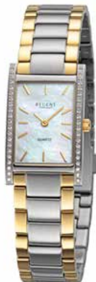
BA-866 188,00 €