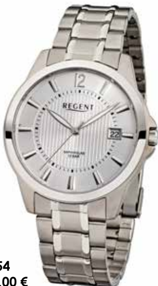
F-554 118,00 €