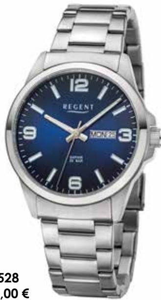
F-1528 118,00 €