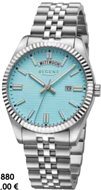
BA-880 148,00 €

Edelstahl, 10 Bar, Ø 40 mm, Druckfaltschließe