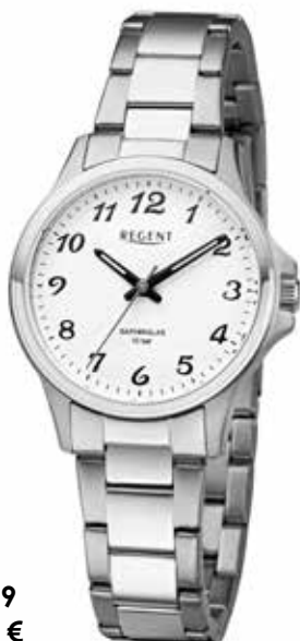
F-1459 79,90 €

Edelstahl IPG, Saphir, 10 Bar, Ø 27 mm, Sicherheits-FaltschlieÙe