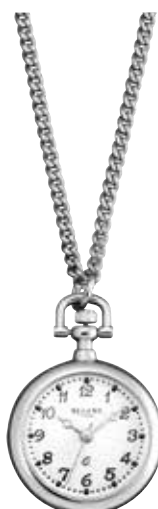
P-766 89,90 €