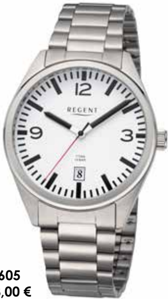
F-1605 128,00 €