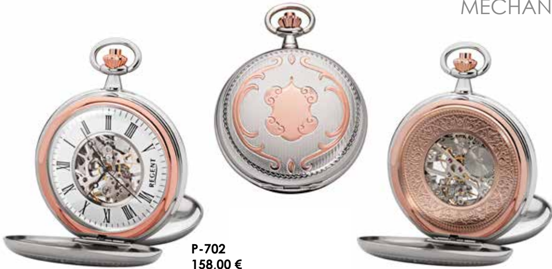
P-702 158,00 €