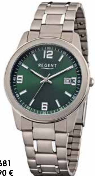
F-1681 69,90 €