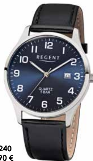
F-1240 59,90 €