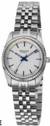
F-1597 118,00 €