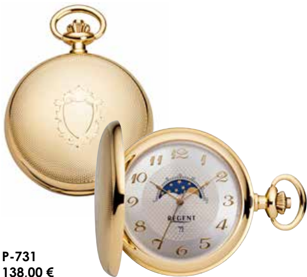
P-731 138,00 €