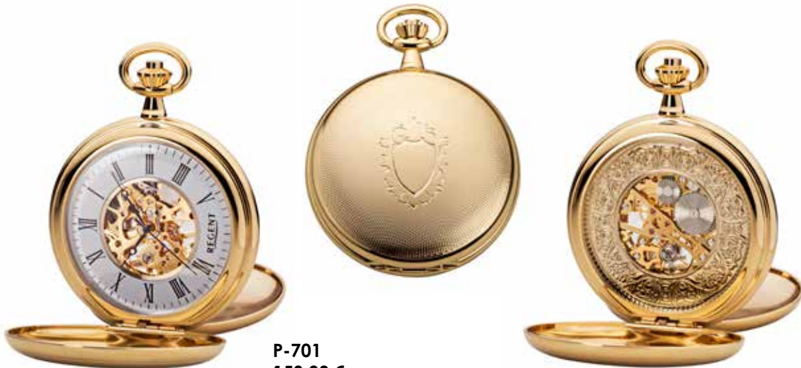
P-701 158,00 €