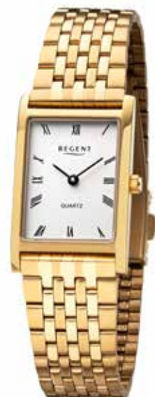
F-1333 99,00 €

Edelstahl + Edelstahl IPG, 3 Bar, 22 x 34 mm, DruckfaltschlieÙe