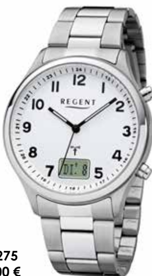
FR-275 99,00 €