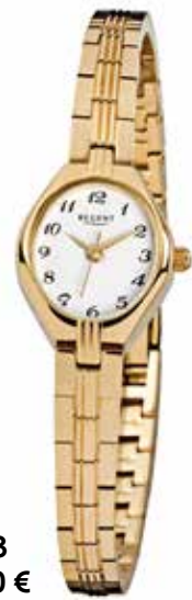
F-303 69,90 €