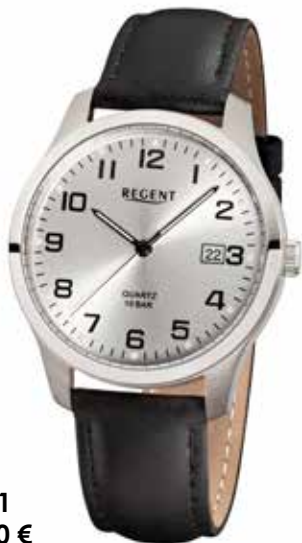
F-931 79,90 €