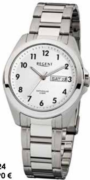
F-524 89,90 €