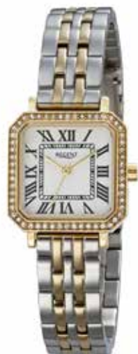
F-1649 99,00 €