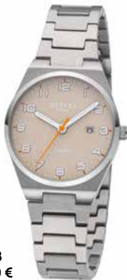
F-1618 128,00 €