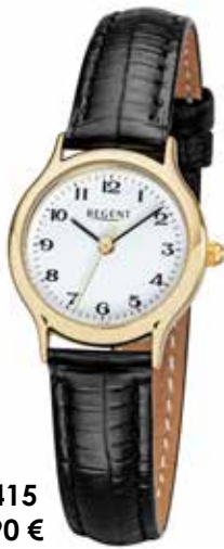
F-1415 89,90 €