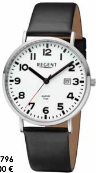
BA-796 99,00 €