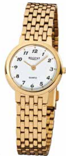
F-910 89,90 €

Edelstahl + Edelstahl IPG, 3 Bar, Ø 26 mm, DruckfaltschlieÙe