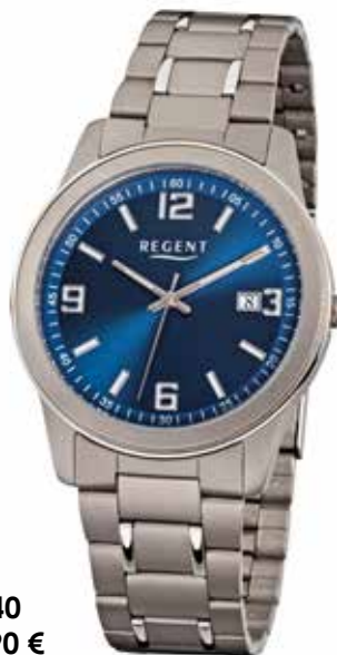
F-840 69,90 €