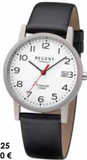
F-1225 69,90 €