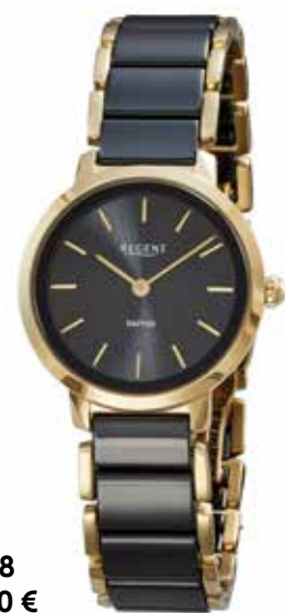
F-1628 198,00 €

Edelstahl/Keramik, Saphir, 3 Bar, Ø 30 mm, Butterfly-SchlieÙe