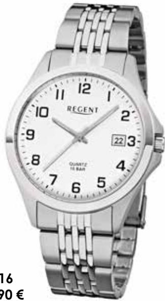
F-916 79,90 €