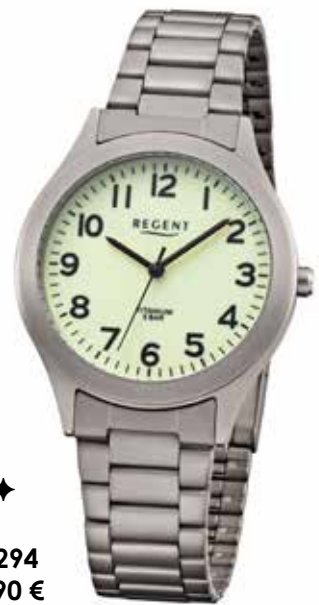
◆◆ ◆ F-1294 59,90 €