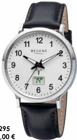
FR-295 138,00 €