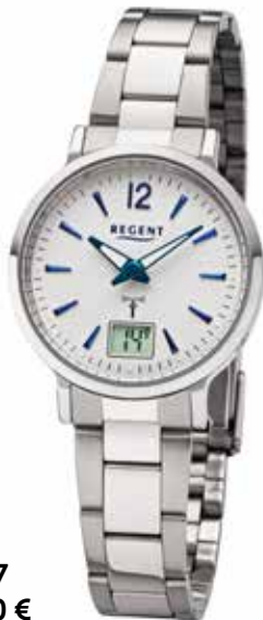
FR-267 138,00 €

Für Liebhaber absoluter Präzision: Uhren, die stets genau die Zeit anzeigen, da sie das Langwellen-Zeitsignal des Zeitzeichensenders DCF77 in Mainflingen empfangen. Dieser ist mit der Atomuhr der Physikalisch-Technischen Bundesanstalt verbunden, die die Zeit mit einer Genauigkeit von nur 1 Sekunde Abweichung in 30.000 Jahren anzeigt.