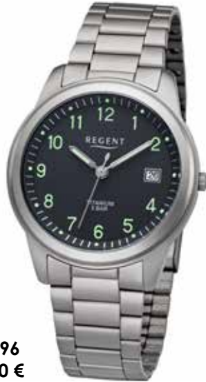
F-1296 69,90 €