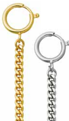
P-44 25,00 €

vergoldet + vernickelt, Flachpanzer, 5 mm