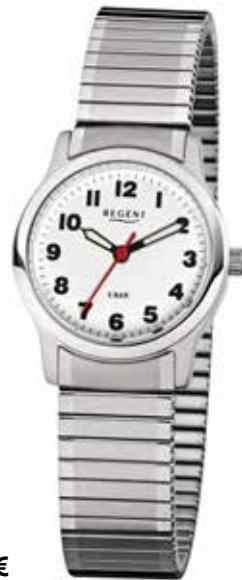
F-898 59,90 €

Edelstahl, 5 Bar, Ø 37 + 28 mm, extra deutlich