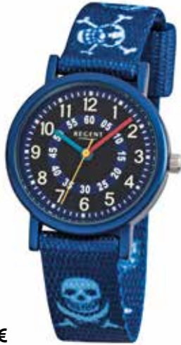
F-951 44,90 €