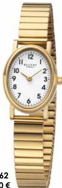
F-1362 79,90 €