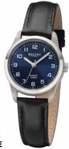
F-1322 59,90 €