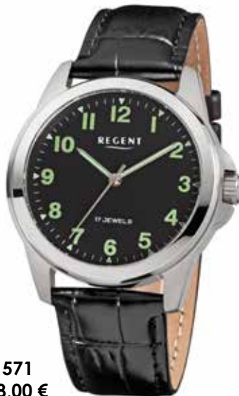
F-1571 138,00 €