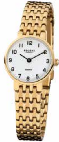
F-716 99,00 €

Edelstahl + Edelstahl IPG, 3 Bar, Ø 24 mm, DruckfaltschlieÙe