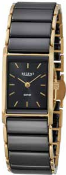
F-1584 198,00 €

Edelstahl/Keramik, Saphir, 3 Bar, 22 x 34 mm, Butterfly-SchlieÙe