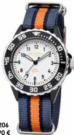
F-1206 39,90 €