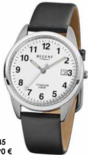
F-685 64,90 €