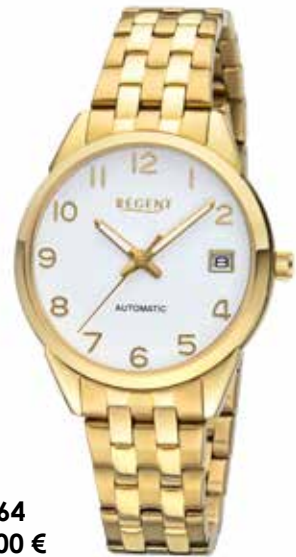
F-1664 198,00 €

Edelstahl + Edelstahl IPG, Automatik, 5 Bar, Ø 35 mm