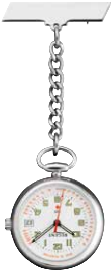
P-754 89,90 €