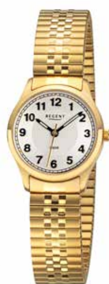
BA-886 89,90 €