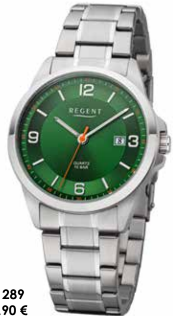
F-1289 89,90 €

Edelstahl, 10 Bar, Ø 39 mm, DruckfallschlieÙe