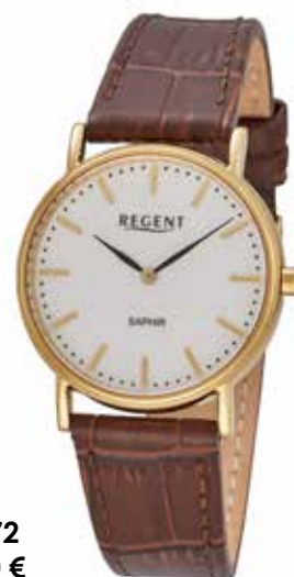
F-1572 99,00 €

Edelstahl + Edelstahl IPG, Saphir, 3 Bar, Ø 33 mm