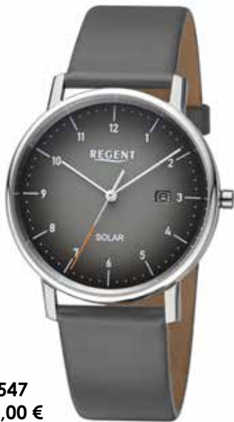
F-1547 148,00 €

Edelstahl IPB oder Edelstahl, 3 Bar, Ø 35 mm