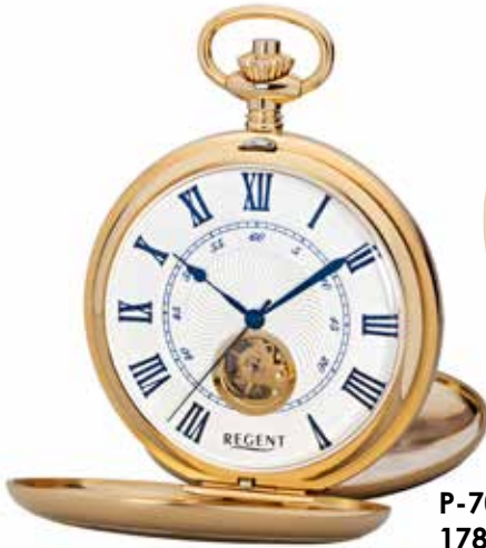
P-708 178,00 €