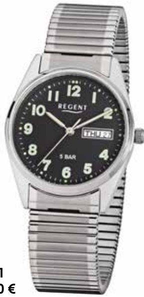
F-291 59,90 €