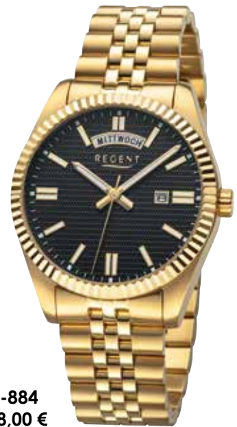
BA-884 158,00 €

Edelstahl + Edelstahl IPG, 10 Bar, Ø 40 mm, Druckfaltschließe