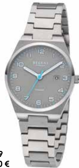
F-1619 128,00 €

Titan, 5 Bar, Ø 30 mm, DruckfallschlieÙe, superflach