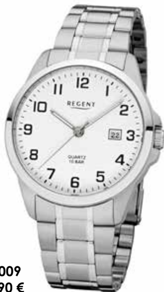
F-1009 59,90 €

Edelstahl, 10 Bar, Ø 39 mm, DruckfallschlieÙe