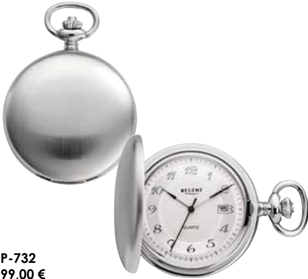
P-732 99,00 €