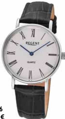
F-1576 69,90 €

Edelstahl + Edelstahl IPG, 3 Bar, Ø 27 mm