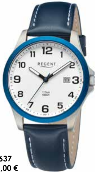
F-1637 118,00 €