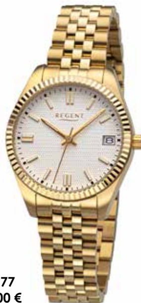
BA-877 148,00 €