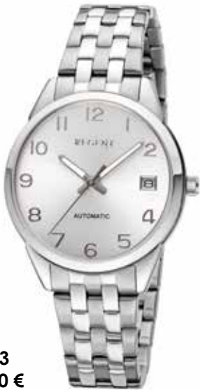
F-1663 188,00 €

Edelstahl + Edelstahl IPG, Automatik, 5 Bar, Ø 34 mm