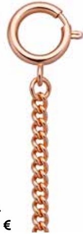
PS-04 28,00 €