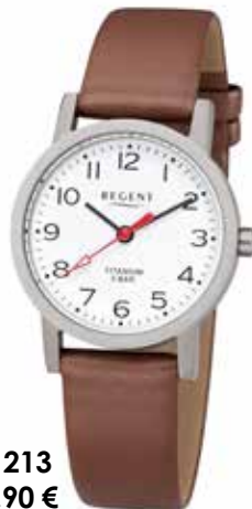
F-1213 59,90 €