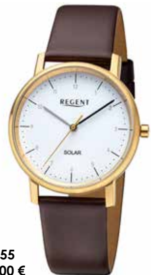
F-1555 138,00 €

Edelstahl IPB + Edelstahl IPG, 3 Bar, Ø 39 mm