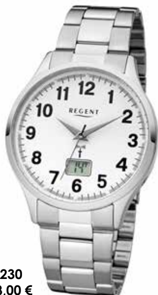
FR-230 148,00 €