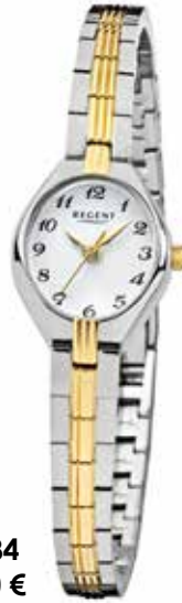
F-1684 69,90 €