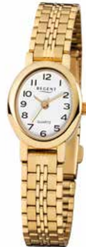
F-394 69,90 €

Edelstahl + Edelstahl IPG, 3 Bar, 20x24 mm, DruckfaltschlieÙe