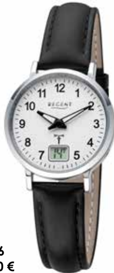
FR-296 138,00 €