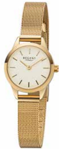
F-1166 79,90 €

Edelstahl + Edelstahl IPG, 3 Bar, Ø 23 mm