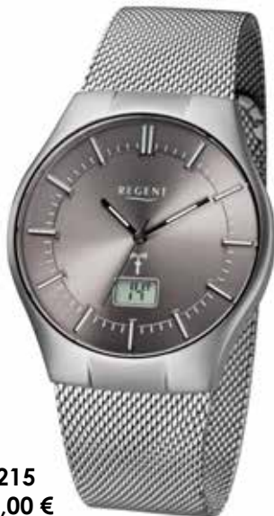
FR-215 168,00 €