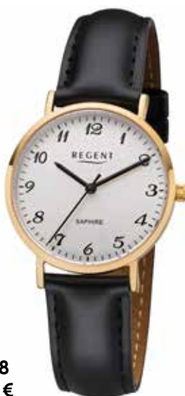
F-1218 99,00 €