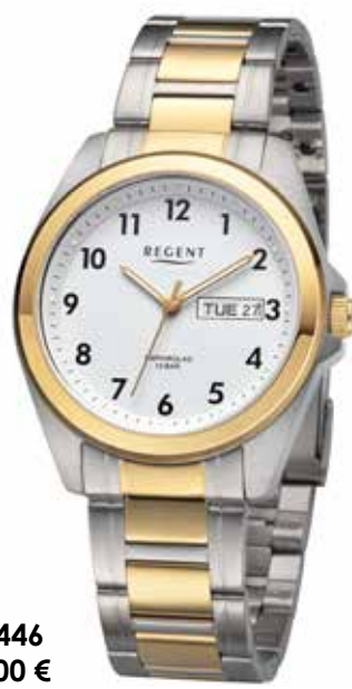
F-1446 99,00 €

Edelstahl + Edelstahl IPG, Saphir, 10 Bar, Ø 38 mm, Datum mit Wochentag