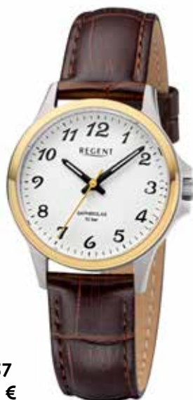
F-1457 79,90 €