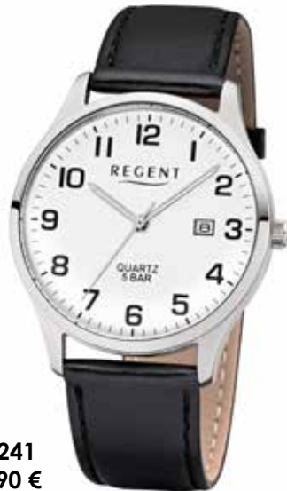
F-1241 59,90 €