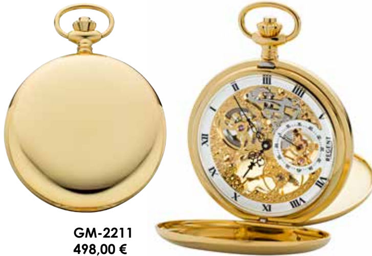
GM-2211 498,00 €

Edelstahl IPG, Hesalitglas, rückseitig Mineralglas, Ø 53 mm