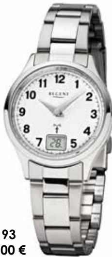
FR-193 148,00 €

Edelstahl + Edelstahl IPG, 5 Bar, Ø 29 mm