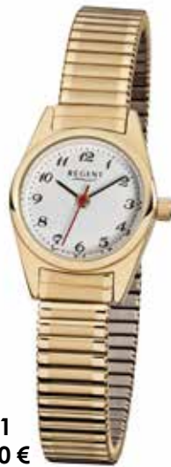
F-271 59,90 €

Edelstahl + Edelstahl IPG, 3 Bar, Ø 22 mm