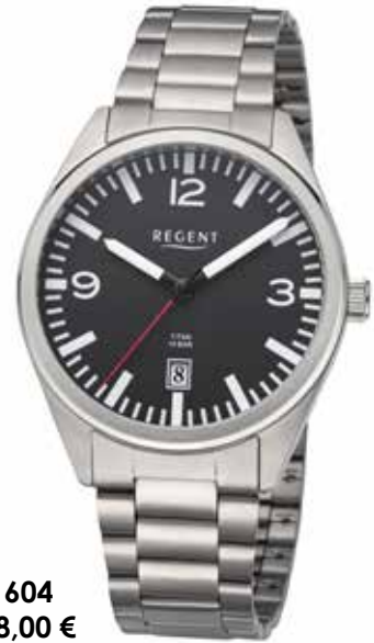
F-1604 128,00 €

Titan, 10 Bar, Ø 40 mm, DruchfaltschlieÙe