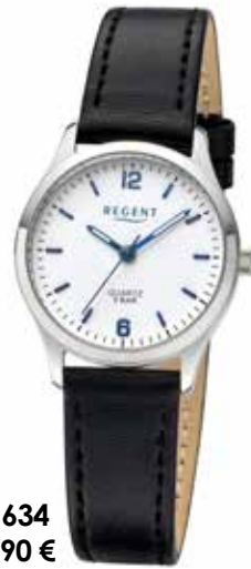
F-1634 59,90 €