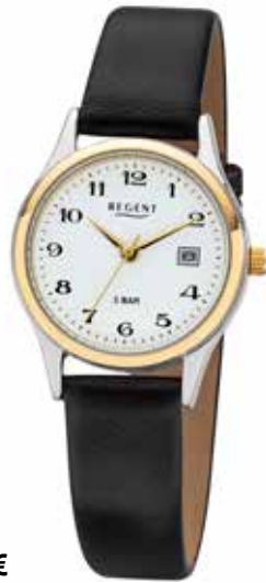
F-834 54,90 €