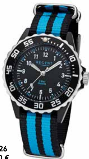
F-1126 39,90 €