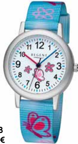
F-1478 44,90 €