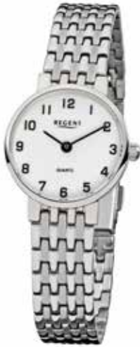
F-609 89,90 €