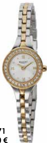
F-1671 99,00 €