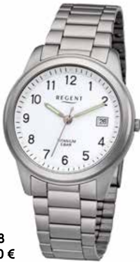
F-208 69,90 €