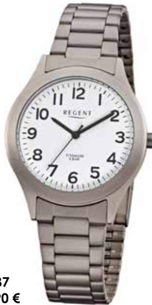
F-837 59,90 €

Die matte, silbergraue Optik der verleiht den Titanuhren ein modernes und unaufdringliches Aussehen. In Verbindung mit Sauerstoff bildet Titan sogar eine dünne Oxidschicht, die leichte, oberflächliche Kratzer abdecken kann.