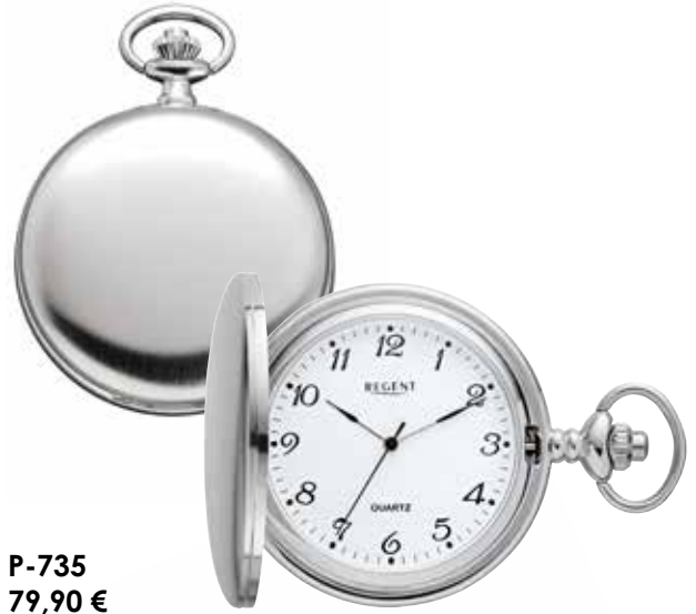
P-735 79,90 €