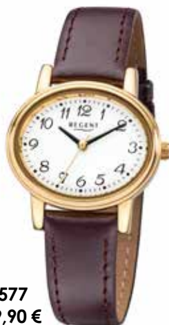
F-577 69,90 €

Edelstahl + Edelstahl IPG, 3 Bar, 30 x 25 mm