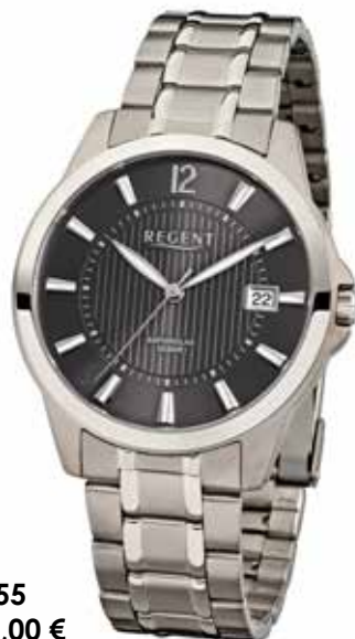
F-555 118,00 €