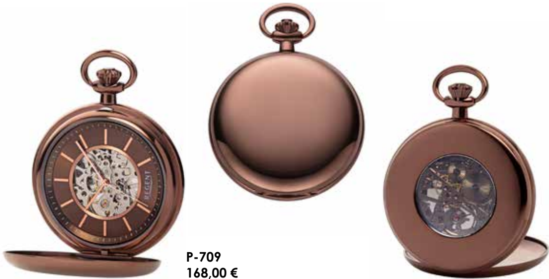
P-709 168,00 €