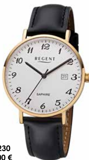
F-1230 99,00 €