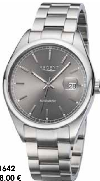
F-1642 198,00 €