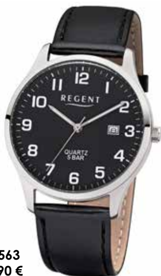
F-1563 59,90 €

Edelstahl + Edelstahl IPG, 5 Bar, Ø 39 mm