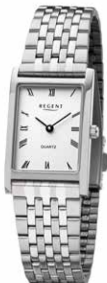
F-1331 89,90 €

Edelstahl + Edelstahl IPG, 3 Bar, Ø 26 mm, DruckfaltschlieÙe