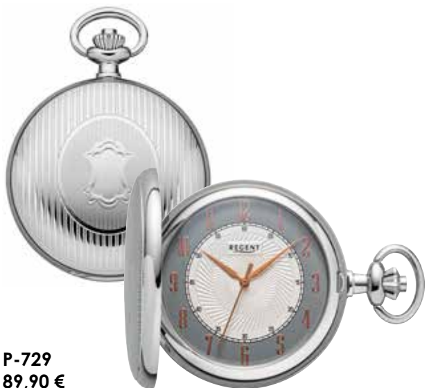
P-729 89,90 €