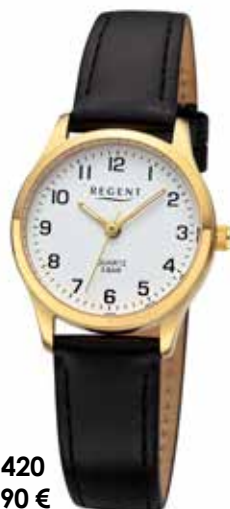
F-1420 59,90 €