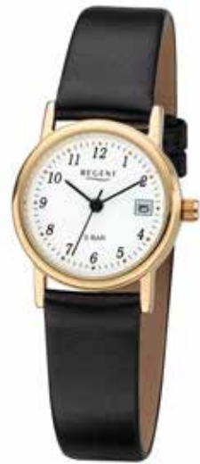
F-829 54,90 €

Edelstahl + Edelstahl IPG, 5 Bar, Ø 25 mm