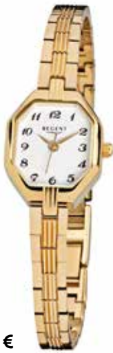
F-305 69,90 €