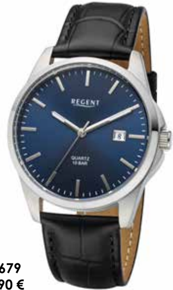
F-1679 59,90 €