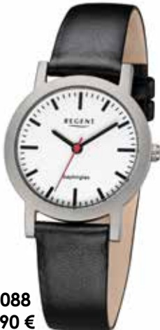
F-1088 89,90 €