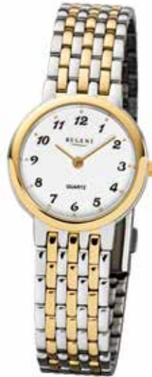
F-1048 89,90 €