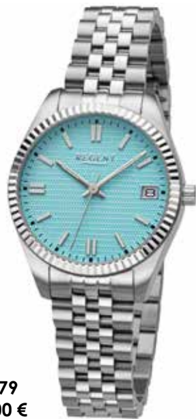
BA-879 138,00 €

Edelstahl + Edelstahl IPG, 5 Bar, Ø 26 mm, DruckfaltschlieÙe