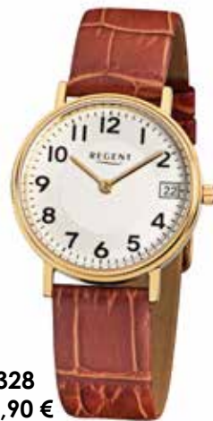
F-328 89,90 €

Edelstahl + Edelstahl IPG, 3 Bar, Ø 28 mm