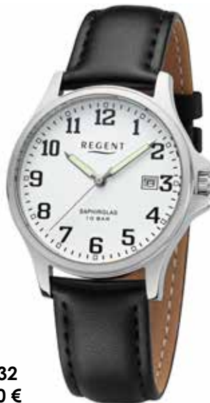
F-1432 69,90 €