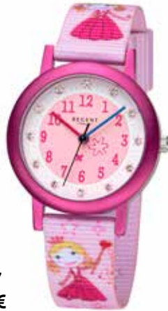
F-1477 44,90 €