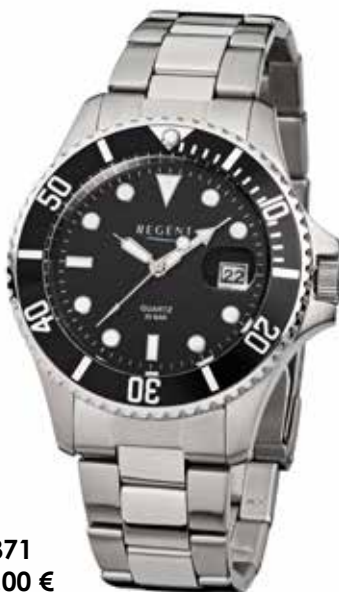
F-371 99,00 €