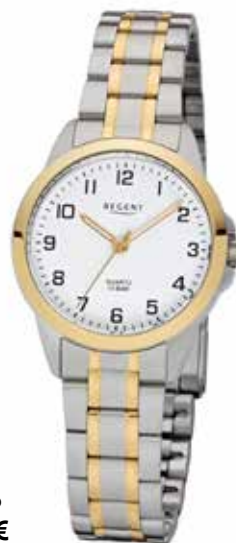
F-1006 69,90 €

Edelstahl + Edelstahl IPG, 10 Bar, Ø 29 mm