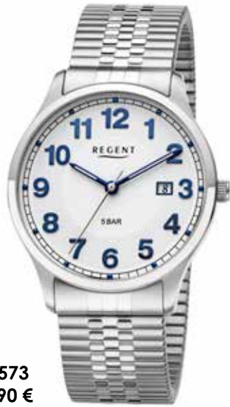
F-1573 89,90 €