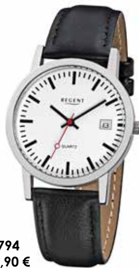
F-794 59,90 €