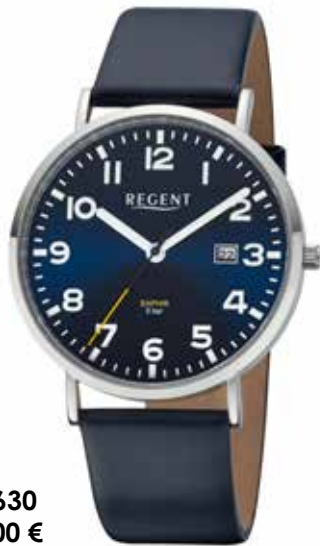
F-1630 99,00 €