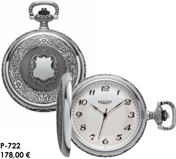
P-722 178,00 €