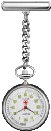
P-756 59,90 €