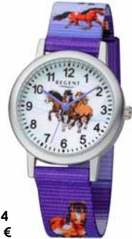
F-1364 44,90 €