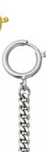
P-45 18,00 €

vergoldet + vernickelt, Flachpanzer, 5 mm