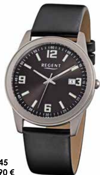
F-845 59,90 €