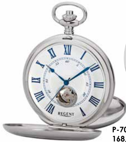
P-707 168,00 €