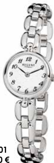
F-1401 89,90 €