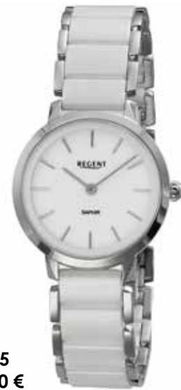
F-1625 188,00 €

In den 80er Jahren entdeckte man Keramik als alternativen Werkstoff für Uhren.