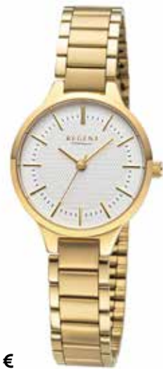
F-1675 138,00 €

Titan + Titan IPG, 5 Bar, Ø 28 mm, DruckfallschlieÙe