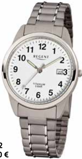
F-432 69,90 €