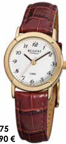
F-575 69,90 €

Edelstahl + Edelstahl IPG, 5 Bar, Ø 25 mm