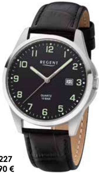
F-1227 59,90 €