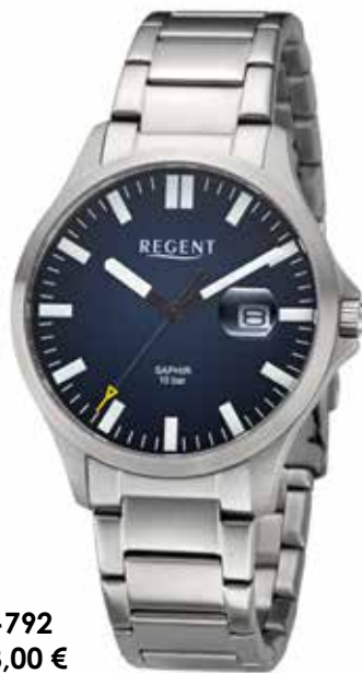
BA-792 118,00 €