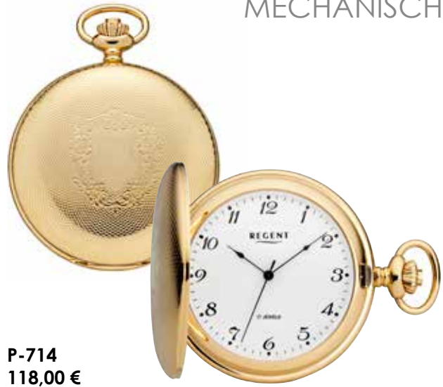
P-714 118,00 €