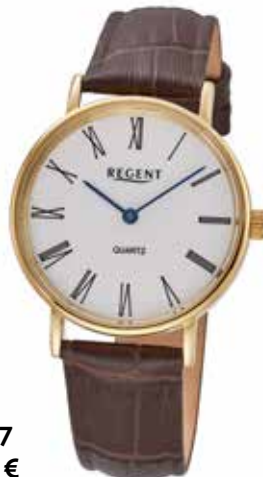
F-1577 79,90 €