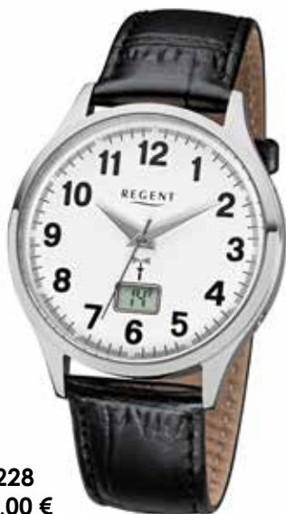
FR-228 148,00 €