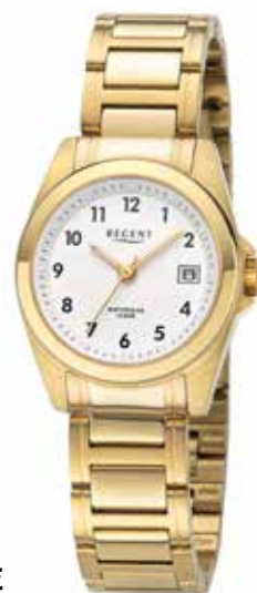
F-1595 99,00 €

Edelstahl IPG, Saphir, 10 Bar, Ø 27 mm, Sicherheits-FaltschlieÙe