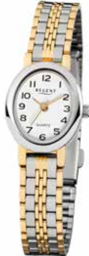
F-393 69,90 €