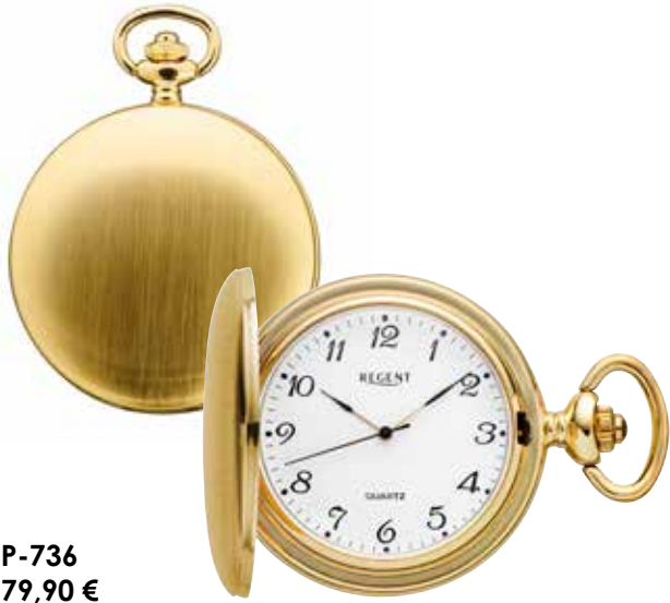
P-736 79,90 €