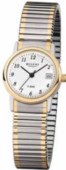
F-889 59,90 €