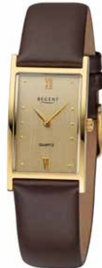
F-1509 128,00 €