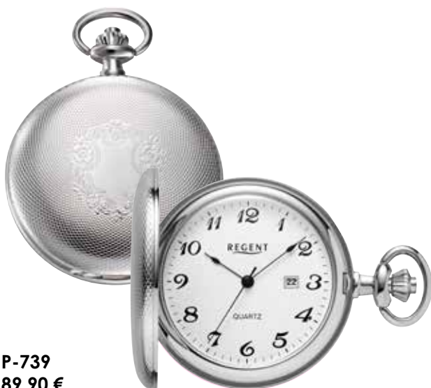
P-739 89,90 €

Taschenuhren sind wieder im Trend und dienen als modisches Accessoire, das von elegant bis lässig getragen werden kann. Sie sind ein Symbol für Präzision und technische Handwerkskunst, die eine lange Geschichte hat. Neben dem modischen Aspekt können Taschenuhren auch mit einer persönlichen Gravur versehen werden, was sie zu einem individuellen und bedeutungsvollen Gegenstand macht.