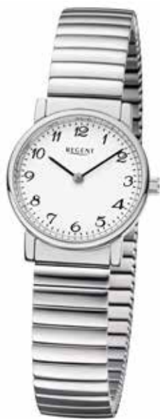
F-1244 69,90 €

Edelstahl + Edelstahl IPG, 3 Bar, Ø 25 mm