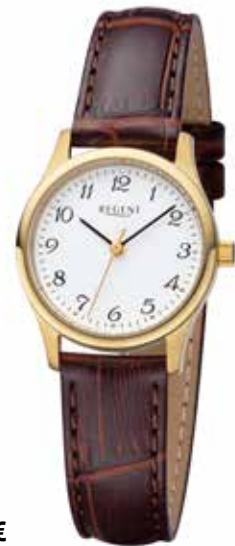
F-1251 69,90 €

Edelstahl + Edelstahl IPG, 3 Bar, Ø 27 mm