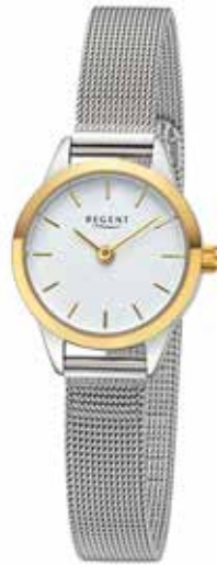
F-1442 79,90 €