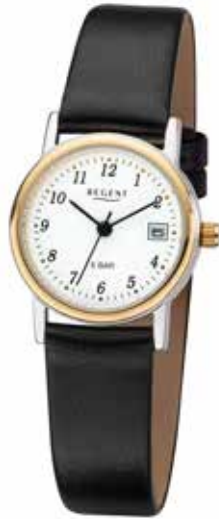
F-828 54,90 €