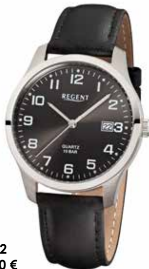
F-932 79,90 €