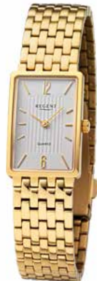
F-1344 138,00 €

Titan + Titan IPG, 5 Bar, Ø 20 x 29 mm, DruckfallschlieÙe