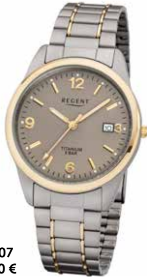
F-1107 79,90 €