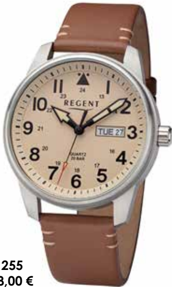
F-1255 118,00 €