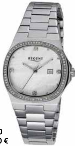
F-1600 148,00 €