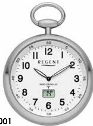
PR-001 178,00 €