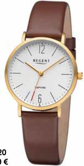
F-1320 99,00 €

Titan + Titan IPG, Saphir, 5 Bar, Ø 32 mm