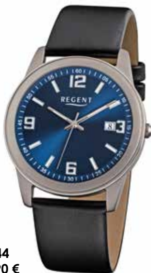
F-844 59,90 €