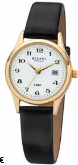
F-835 54,90 €

Edelstahl + Edelstahl IPG, 5 Bar, Ø 28 mm