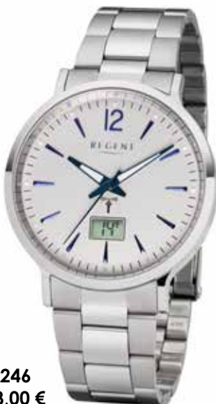
FR-246 138,00 €

Edelstahl + Edelstahl IPG, 3 Bar, Ø 30 mm