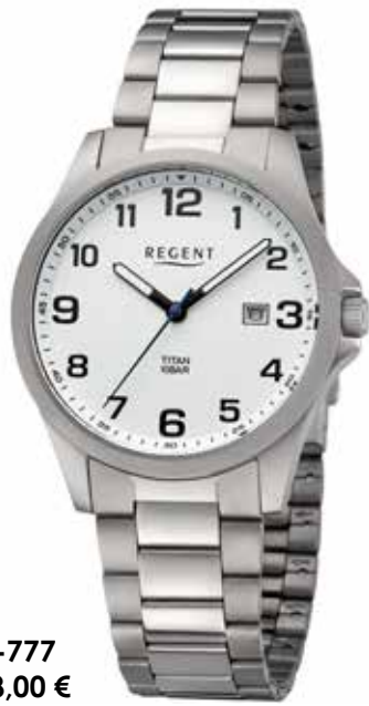
BA-777 118,00 €