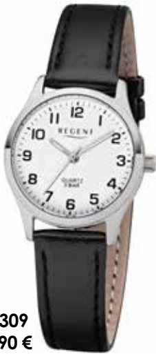
F-1309 59,90 €

Edelstahl + Edelstahl IPG, 5 Bar, Ø 25 mm