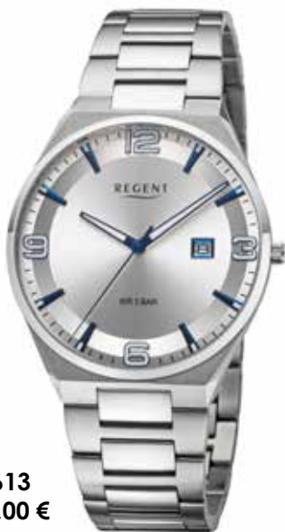
F-1613 138,00 €

Edelstahl, Saphir, 10 Bar, Ø 40 mm, DruckfallschlieÙe