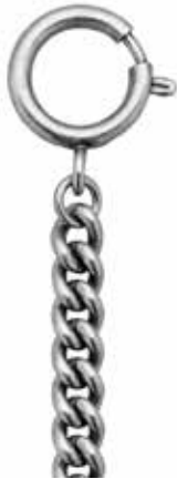
PS-01 28,00 €