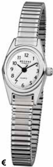
F-262 54,90 €