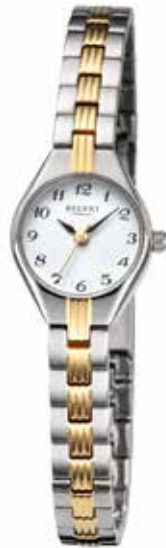
F-1469 118,00 €