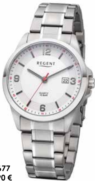
F-1677 89,90 €