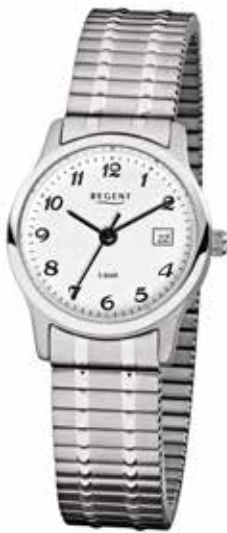
F-885 69,90 €

Edelstahl + Edelstahl IPG, 5 Bar, Ø 25 mm