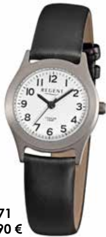
F-871 49,90 €