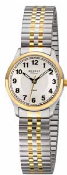
BA-887 89,90 €