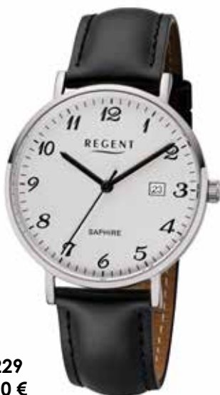
F-1229 89,90 €