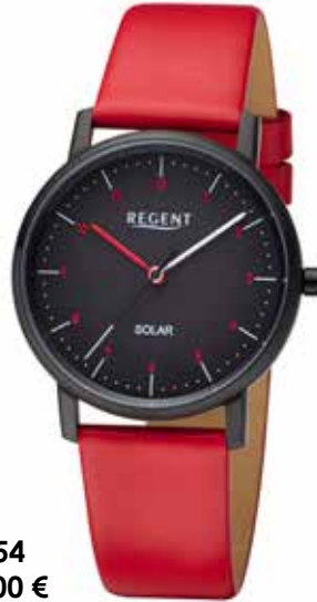
F-1554 138,00 €

Edelstahl IPB oder Edelstahl, 3 Bar, Ø 35 mm