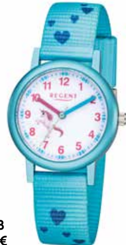
F-1208 44,90 €