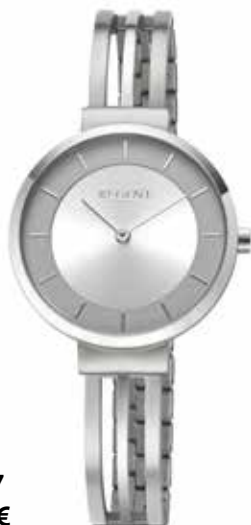
F-1657 89,90 €