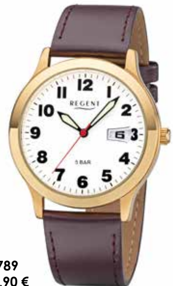
F-789 69,90 €

Edelstahl + Edelstahl IPG, 5 Bar, Ø 39 mm, extra deutlich