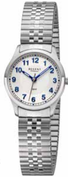
BA-885 79,90 €