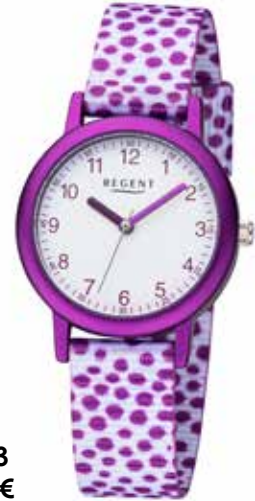
F-1383 44,90 €