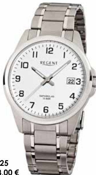
F-925 118,00 €