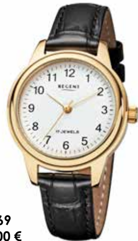
F-1569 148,00 €

Edelstahl + Edelstahl IPG, 5 Bar, Ø 32 mm, Handaufzug