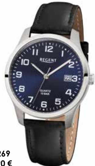
F-1269 79,90 €