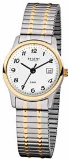
F-887 79,90 €