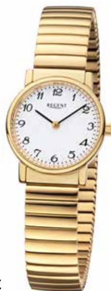
F-1243 79,90 €

Edelstahl + Edelstahl IPG, 3 Bar, Ø 27 mm