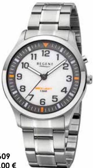
F-1609 118,00 €

Edelstahl, 5 Bar, Ø 39 mm, Hintergrundbeleuchtung