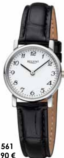
F-1561 59,90 €