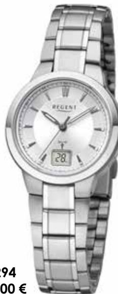
FR-294 168,00 €

Titan - benannt nach dem ältesten Göttergeschlecht der griechischen Mythologie, ist als Oxid-Verbindung weit verbreitet. Bedeutend seltener kommt es als reines Metall vor, daher muss es in aufwendigen Produktionsprozessen gewonnen werden.