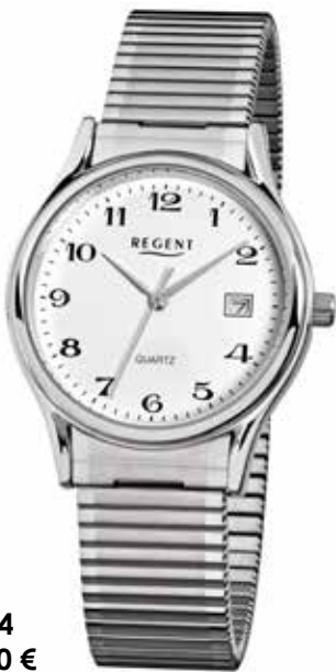
F-874 59,90 €

Edelstahl + Edelstahl IPG, 5 Bar, Ø 33 mm, Datum mit Wochentag