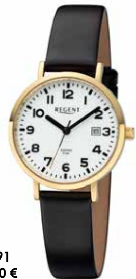
BA-791 118,00 €

Edelstahl + Edelstahl IPG, Saphir, 5 Bar, Ø 31 mm