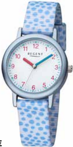
F-1381 44,90 €