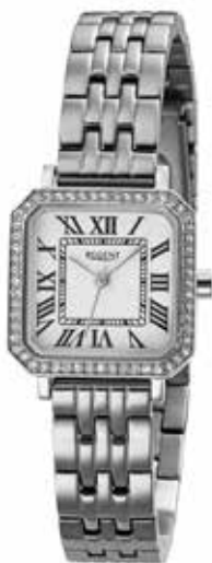
F-1647 89,90 €

Edelstahl + Edelstahl IPG, 3 Bar, Ø 26 mm