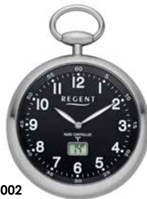
PR-002 178,00 €