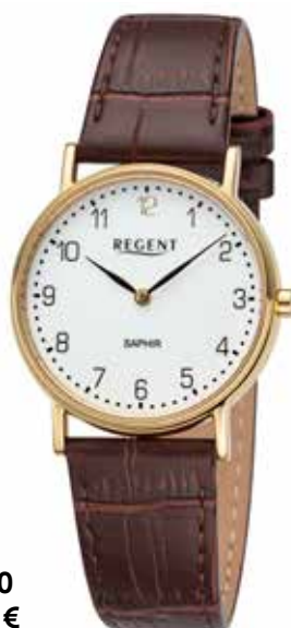
F-1430 99,00 €