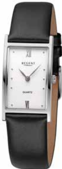
F-1507 118,00 €

Titan + Titan IPG, Saphir, 5 Bar, Ø 32 mm