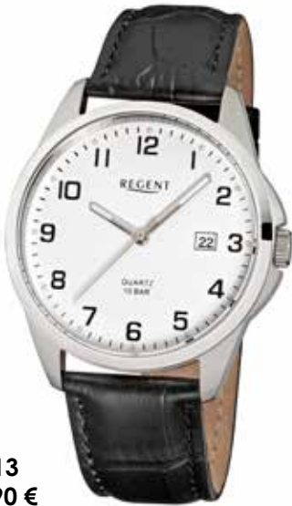
F-913 59,90 €

Edelstahl + Edelstahl IPG, 10 Bar, Ø 39 mm