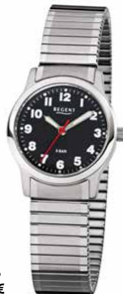
F-1016 59,90 €

Edelstahl, 5 Bar, Ø 37 + 28 mm, extra deutlich