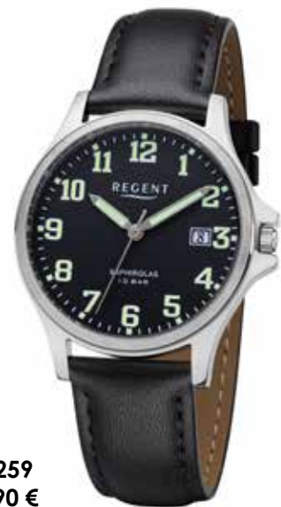
F-1259 69,90 €