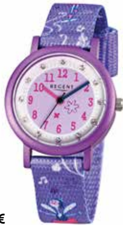
F-486 44,90 €