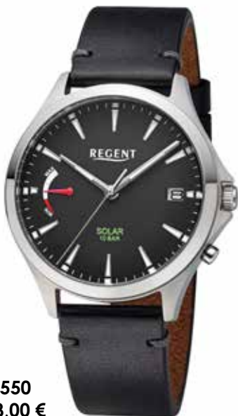
F-1550 158,00 €

Titan + Titan IPG, 5 Bar, Ø 30 mm, DruckfallschlieÙe