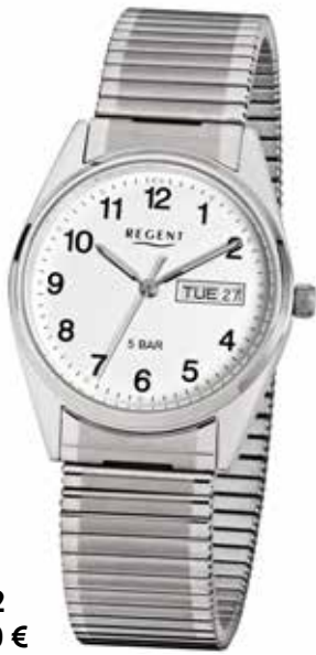
F-292 59,90 €