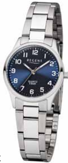
F-1325 59,90 €