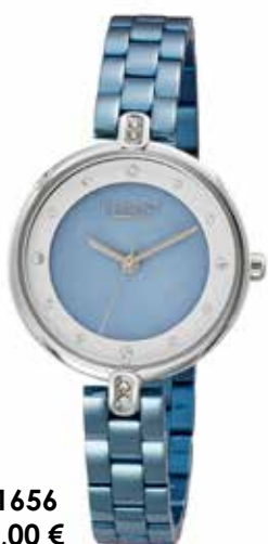
F-1656 99,00 €