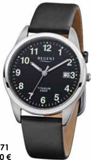
F-1271 64,90 €