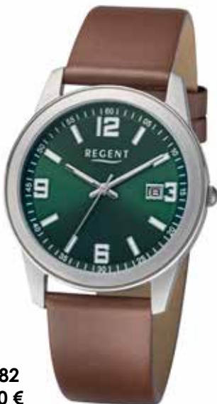
F-1682 59,90 €