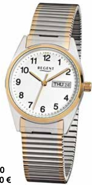
F-880 69,90 €

Edelstahl + Edelstahl IPG, 5 Bar, Ø 33 mm, Datum mit Wochentag