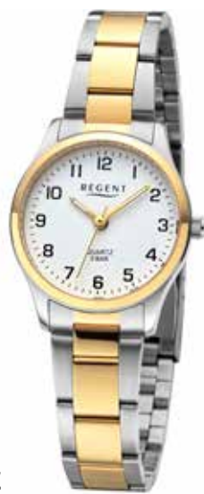
F-1636 59,90 €