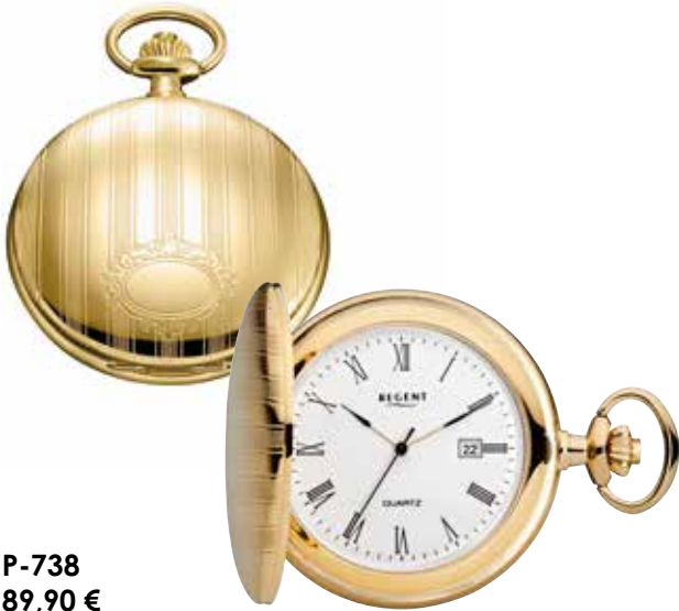
P-738 89,90 €