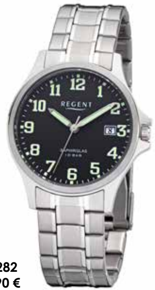
F-1282 79,90 €