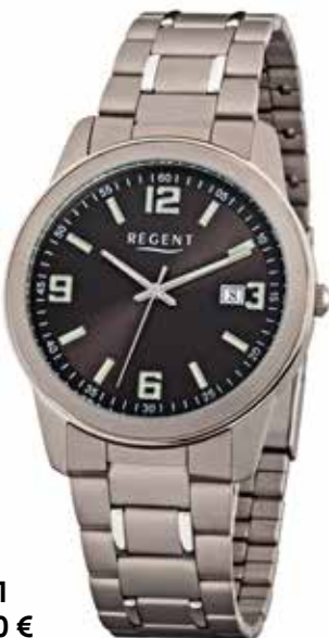
F-841 69,90 €