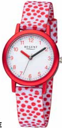
F-1382 44,90 €