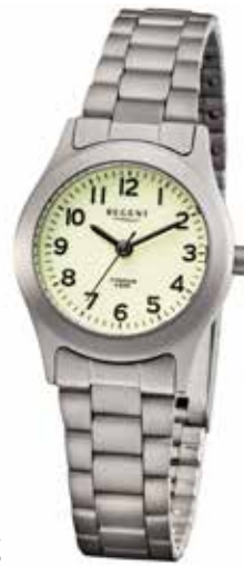
F-1674 59,90 €