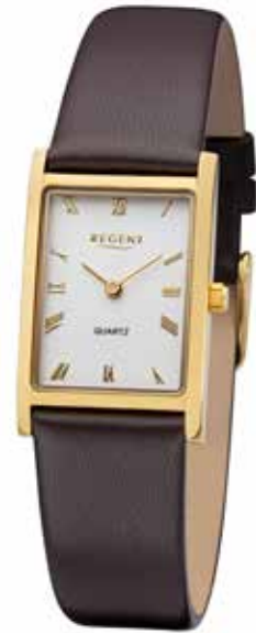
F-1302 99,00 €

Edelstahl + Edelstahl IPG, 3 Bar, 22 x 34 mm