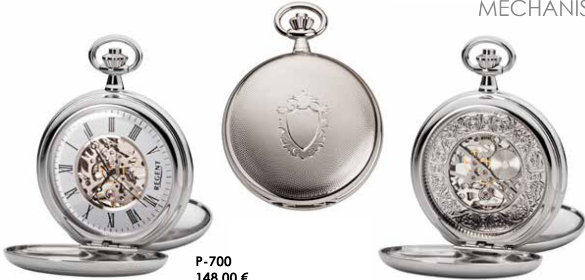
P-700 148,00 €