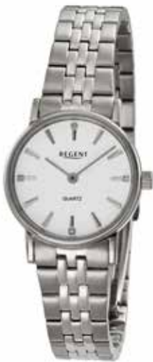
F-1622 99,00 €

Edelstahl + Edelstahl IPG, 3 Bar, Ø 23 mm