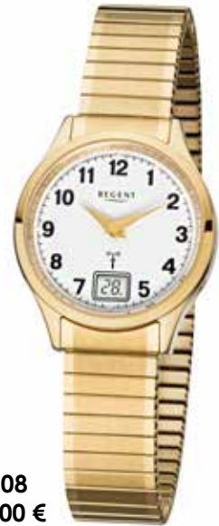
FR-208 148,00 €

Edelstahl + Edelstahl IPG, 5 Bar, Ø 29 mm, DruckfallschlieÙe + Zugband