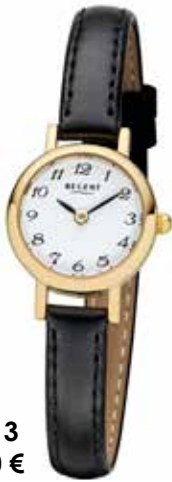
F-1413 89,90 €