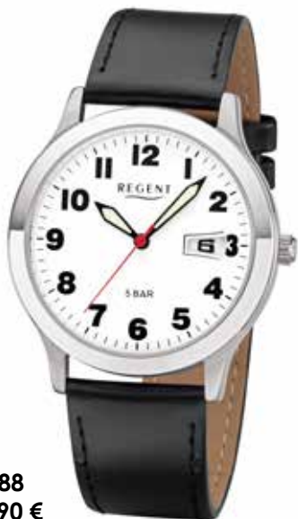
F-788 59,90 €