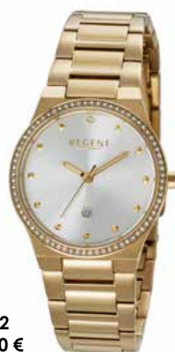
F-1662 118,00 €

Edelstahl + Edelstahl IPG, 5 Bar, Ø 30 mm, DruckfaltschlieÙe