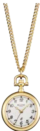
P-765 99,00 €