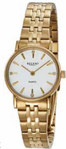
F-1624 99,00 €

Edelstahl + Edelstahl IPG, 3 Bar, Ø 26 mm