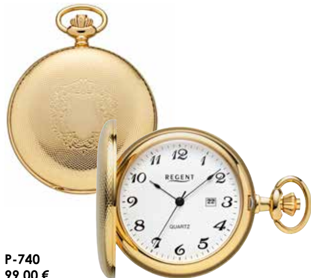
P-740 99,00 €