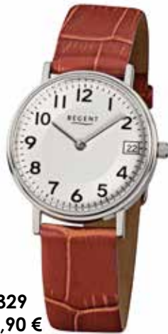
F-329 79,90 €

Edelstahl + Edelstahl IPG, 3 Bar, 22 x 34 mm