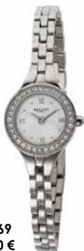
F-1669 89,90 €