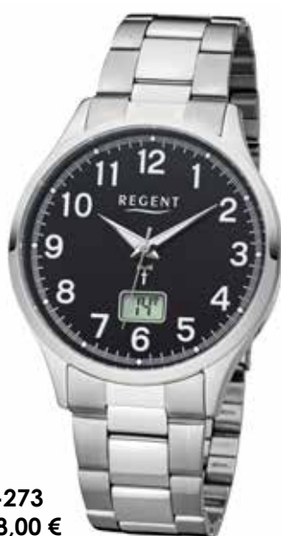
FR-273 148,00 €