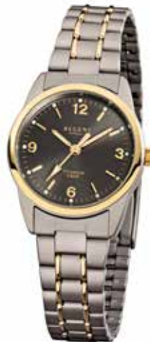
F-429 79,90 €