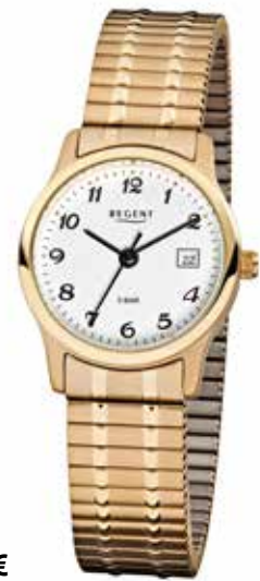
F-886 79,90 €

Edelstahl + Edelstahl IPG, 5 Bar, Ø 27 mm