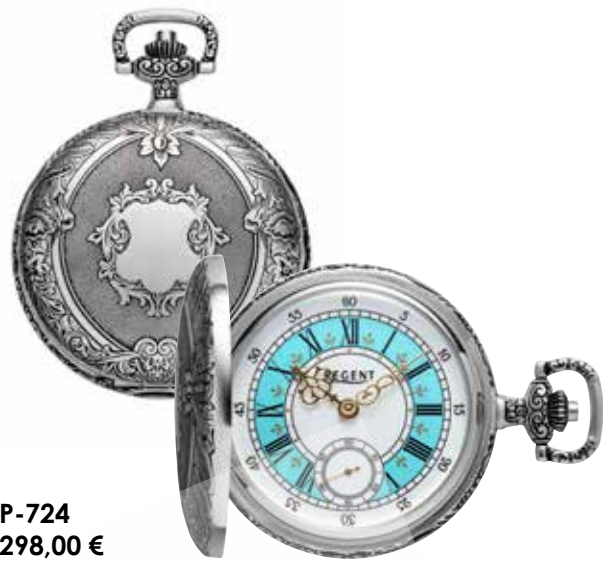
P-724 298,00 €