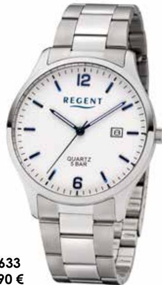
F-1633 59,90 €