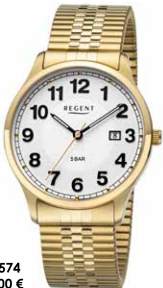
F-1574 99,00 €