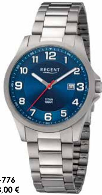
BA-776 118,00 €