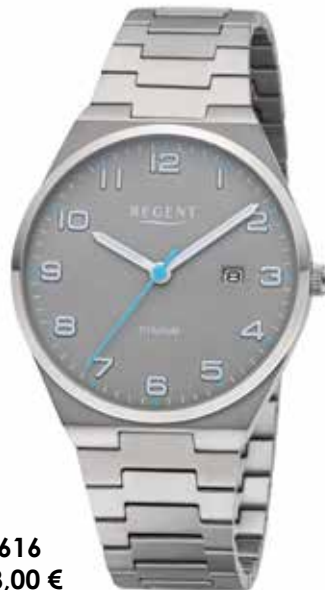
F-1616 128,00 €