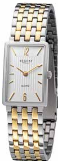
F-1471 138,00 €