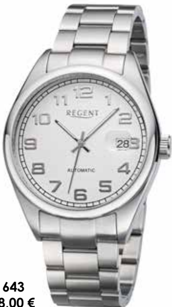
F-1643 198,00 €

Edelstahl + Edelstahl IPG, Automatik, 5 Bar, Ø 35 mm