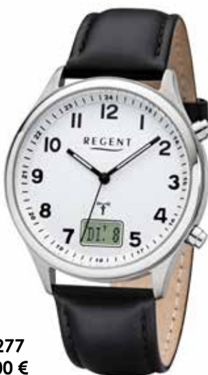
FR-277 99,00 €