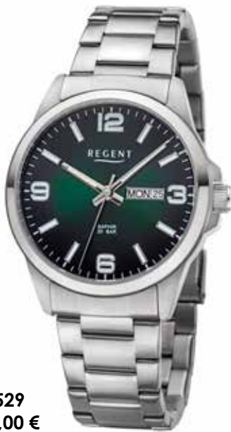
F-1529 118,00 €

Edelstahl und Edelstahl IPG, 10 Bar, Ø 39 mm