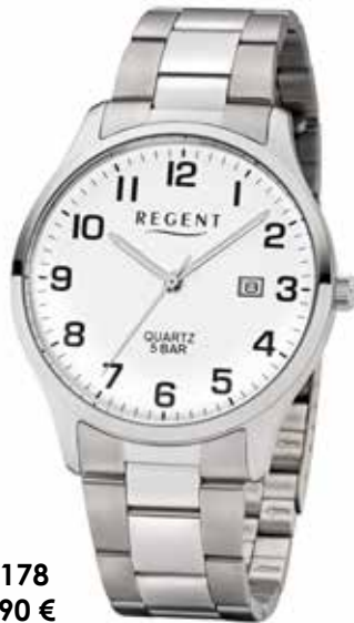
F-1178 59,90 €