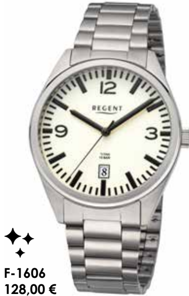
◆◆◆ F-1606 128,00 €