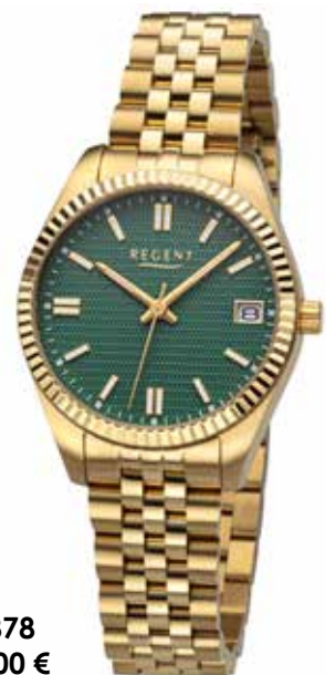
BA-878 148,00 €

Edelstahl IPG, 10 Bar, Ø 34 mm, DruckfaltschlieÙe