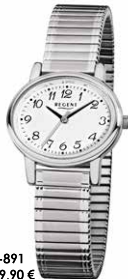
F-891 69,90 €