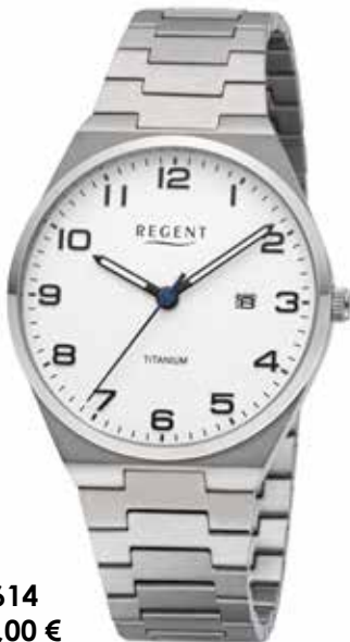
F-1614 128,00 €