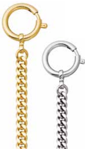
P-42 28,00 €

vergoldet + vernickelt, Flachpanzer, 6 mm