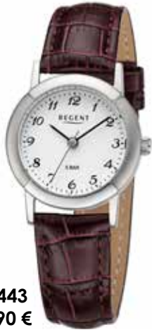
F-1443 59,90 €

Sie ist der perfekte Begleiter für den Alltag und besondere Anlässe gleichermaßen und besticht durch ihr Understatement und ihre Beständigkeit.