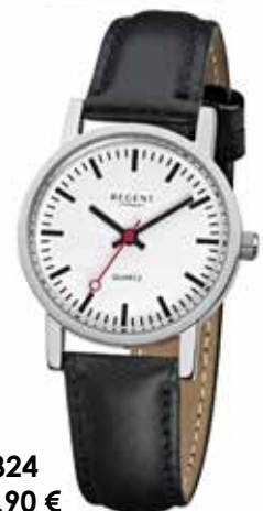
F-824 49,90 €