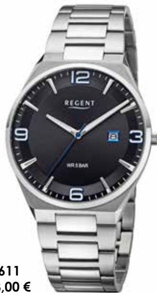
F-1611 138,00 €