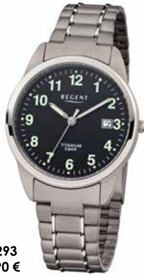
F-1293 69,90 €