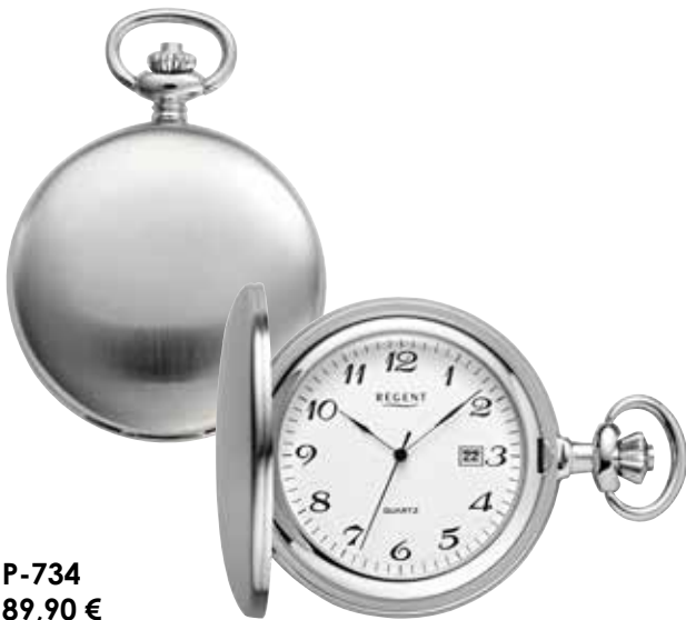
P-734 89,90 €