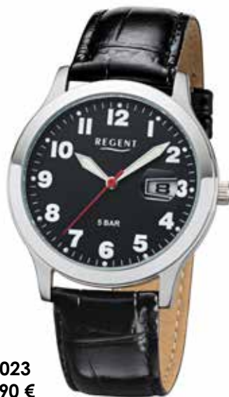
F-1023 59,90 €