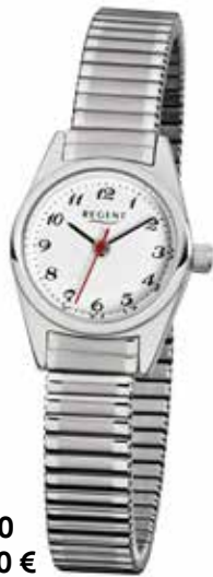
F-270 49,90 €

Edelstahl + Edelstahl IPG, 3 Bar, 19 x 21 mm