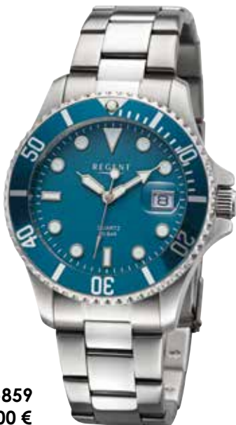
BA-859 99,00 €

Edelstahl + Edelstahl IPG, 10 Bar, Ø 40 mm, Druckfaltschließe