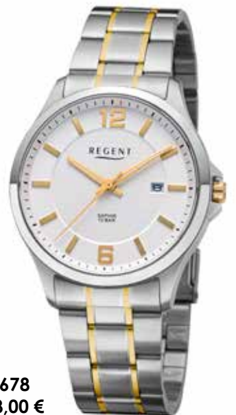
F-1678 118,00 €

Edelstahl und Edelstahl IPG, Saphir, 10 Bar, Ø 39 mm