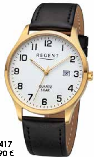
F-1417 59,90 €

Edelstahl + Edelstahl IPG, 5 Bar, Ø 39 mm