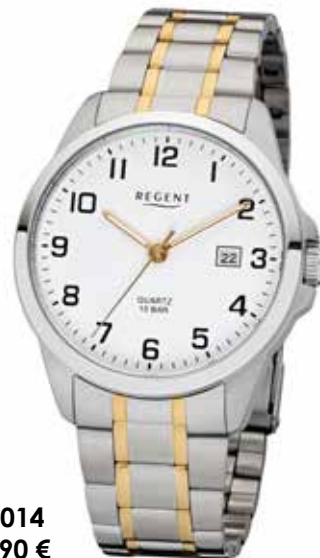
F-1014 69,90 €

Edelstahl und Edelstahl IPG, 10 Bar, Ø 39 mm