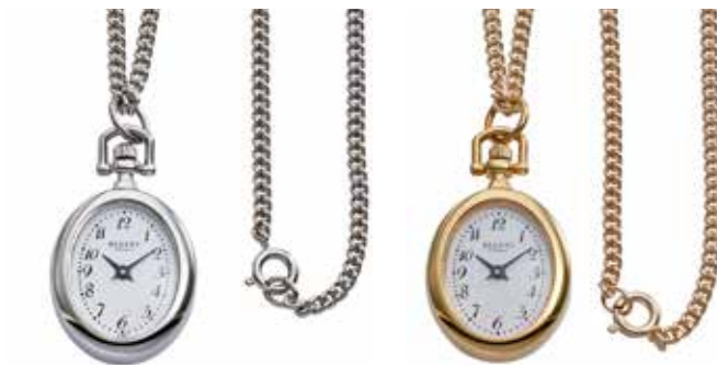
P-779 128,00 €