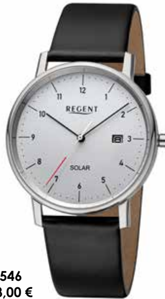
F-1546 148,00 €