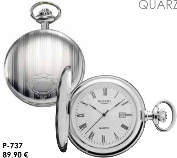
P-737 89,90 €