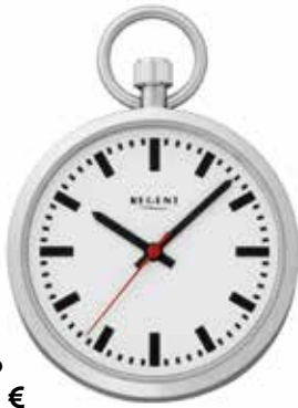
P-776 69,90 €