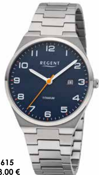
F-1615 128,00 €

Titan, 5 Bar, Ø 40 mm, DruckfallschlieÙe, superflach