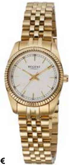
F-1599 128,00 €

Edelstahl + Edelstahl IPG, 5 Bar, Ø 26 mm, DruckfaltschlieÙe