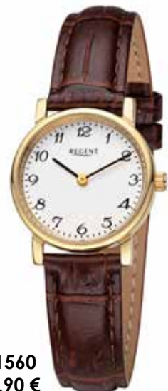
F-1560 69,90 €

Edelstahl + Edelstahl IPG, 5 Bar, Ø 28 mm