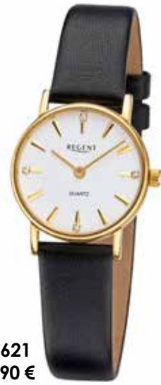
F-1621 89,90 €

Edelstahl + Edelstahl IPG, 3 Bar, Ø 24 mm