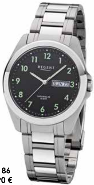
F-1186 89,90 €

Edelstahl, Saphir, 10 Bar, Ø 38 mm, Datum mit Wochentag