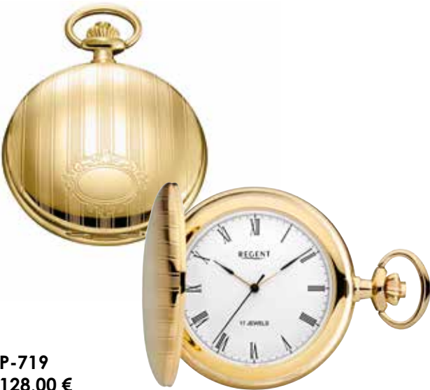
P-719 128,00 €