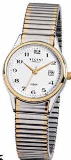
F-461 69,90 €