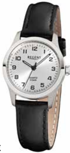
F-899 59,90 €