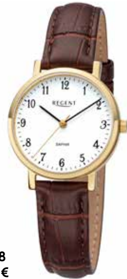
F-1428 89,90 €

Edelstahl + Edelstahl IPG, Saphir, 3 Bar, Ø 30 mm