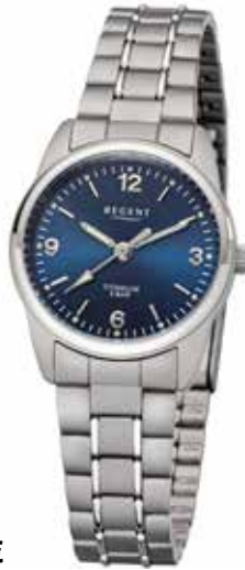
F-1342 69,90 €