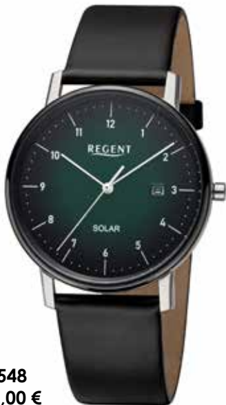
F-1548 158,00 €