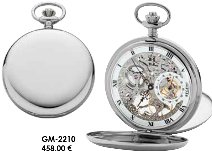
GM-2210 458,00 €

Edelstahl, Hesalitglas, rückseitig Mineralglas, Ø 53 mm