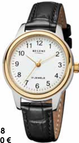
F-1568 148,00 €