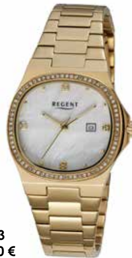
F-1603 158,00 €

Edelstahl IPG, 5 Bar, Ø 30 mm, DruckfaltschlieÙe