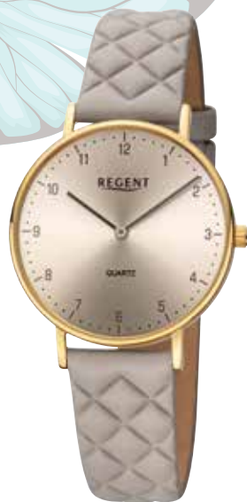
BA-855 UVP 89,90 €