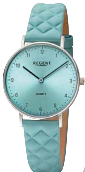
BA-851 UVP 79,90 €