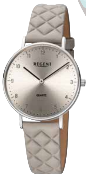
BA-850 UVP 79,90 €