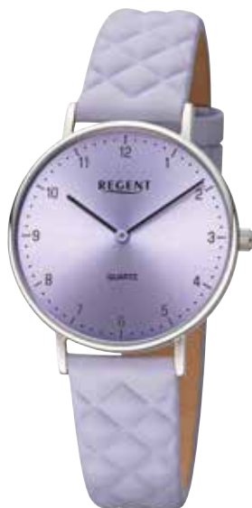
BA-852 UVP 79,90 €