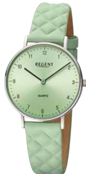
BA-853 UVP 79,90 €