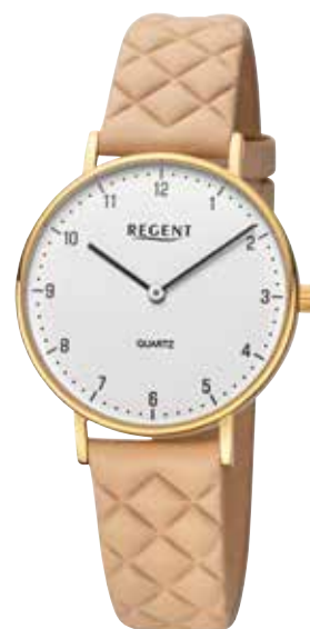
BA-854 UVP 89,90 €

Edelstahl oder Edelstahl IPG, Ø 34mm, Mineralglas, Lederband