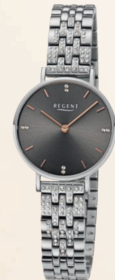
BA-873 UVP 138,-€