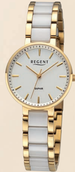
F-1464 UVP 228,-€