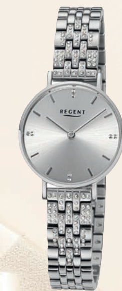
BA-872 UVP 138,-€

Edelstahl oder Edelstahl IPG, massives Edelstahlband, Ø 28mm, 3 Bar