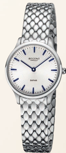
BA-870 UVP 148,-€

Edelstahl oder Edelstahl IPG, massives Edelstahlband, Cabouchon-Krone Ø 29mm, 5 Bar