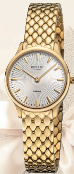
BA-871 UVP 158,-€