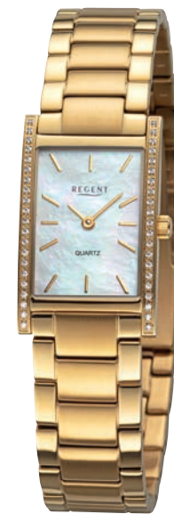
BA-867 UVP 188,-€