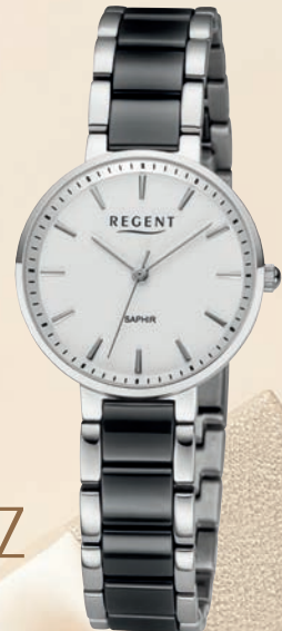
F-1467 UVP 198,-€