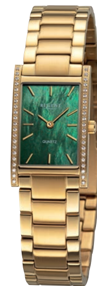
BA-868 UVP 188,-€

Edelstahl oder Edelstahl IPG, massives Edelstahlband, 20 x 32,5mm, 5 Bar