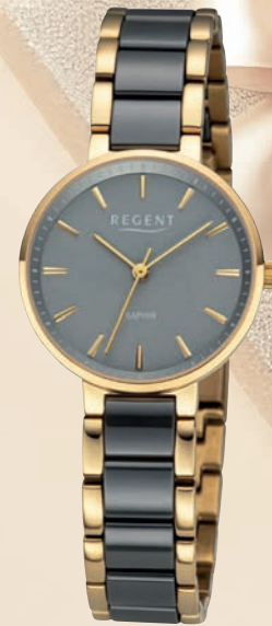
F-1465 UVP 228,-€