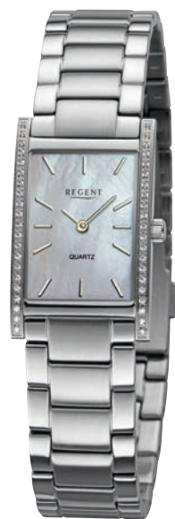
BA-865 UVP 178,-€