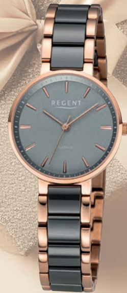
F-1466 UVP 228,-€

Edelstahl oder Edelstahl IPG/IPR, Saphirglas, Keramik-Edelstahlband, Ø 30mm, 3 Bar