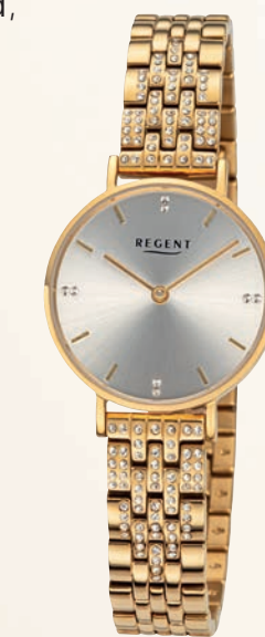
BA-874 UVP 148,-€