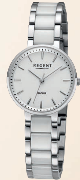
F-1463 UVP 198,-€