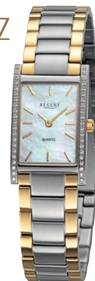
BA-866 UVP 188,-€