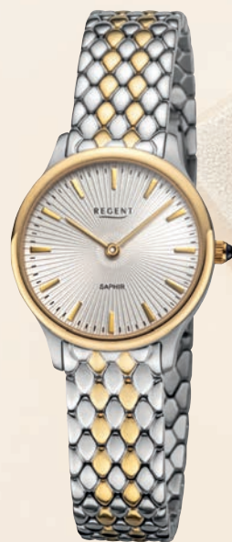
BA-869 UVP 158,-€

Edelstahl oder Edelstahl IPG, massives Edelstahlband, Cabouchon-Krone Ø 29mm, 5 Bar