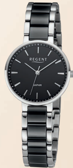
F-1462 UVP 198,-€