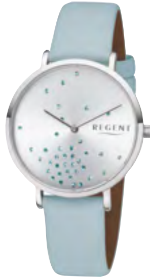
BA-599 Metall IPS, 3 Bar UVP 54,90 €