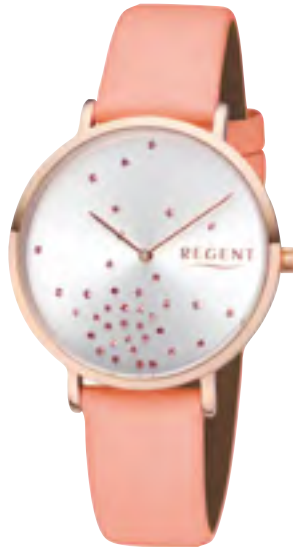
BA-601 Metall IPR, 3 Bar UVP 59,90 €