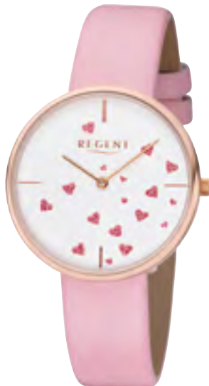
BA-608 Metall IPR, 3 Bar UVP 49,90 €