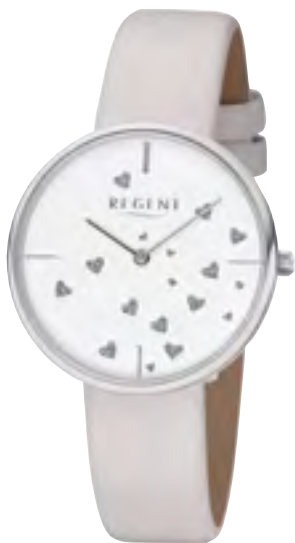
BA-606 Metall IPS, 3 Bar UVP 49,90 €