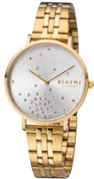
BA-596 Metall IPG, 3 Bar UVP 69,90 €