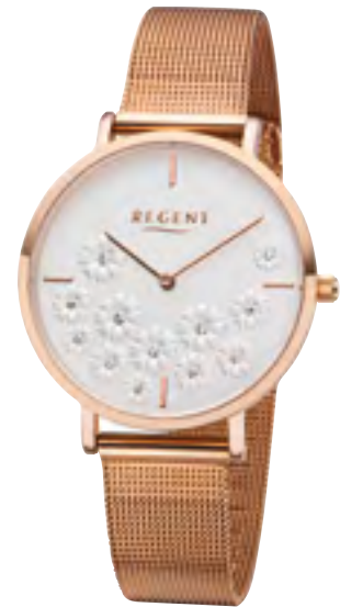
BA-589 Metall IPR, 3 Bar UVP 69,90 €