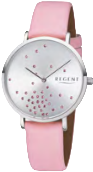
BA-597 Metall IPS, 3 Bar UVP 54,90 €