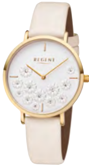
BA-591 Metall IPG, 3 Bar UVP 59,90 €