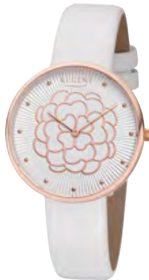
BA-604 Metall IPR, 3 Bar UVP 59,90 €