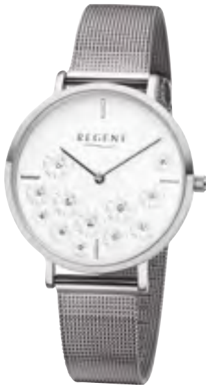
BA-587 Metall IPS, 3 Bar UVP 59,90 €