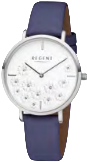
BA-590 Metall IPS, 3 Bar UVP 54,90 €