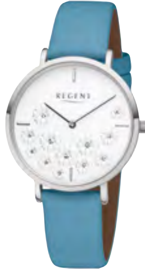
BA-592 Metall IPS, 3 Bar UVP 54,90 €