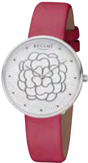
BA-602 Metall IPS, 3 Bar UVP 54,90 €