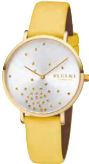
BA-600 Metall IPG, 3 Bar UVP 59,90 €