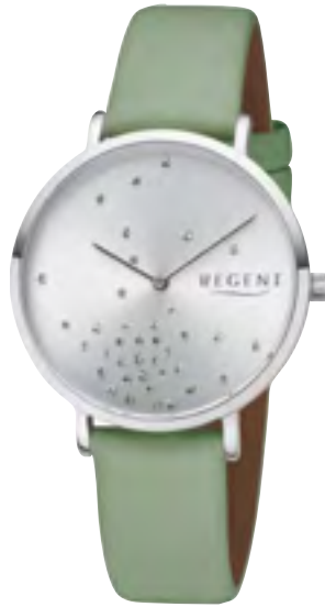
BA-598 Metall IPS, 3 Bar UVP 54,90 €