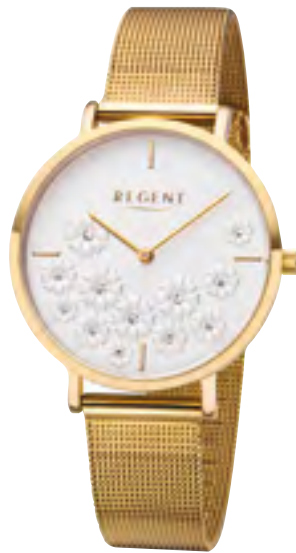
BA-588 Metall IPG, 3 Bar UVP 69,90 €