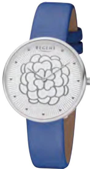
BA-603 Metall IPS, 3 Bar UVP 54,90 €