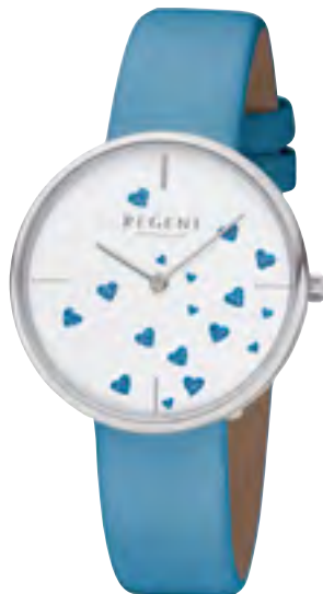
BA-607 Metall IPS, 3 Bar UVP 49,90 €