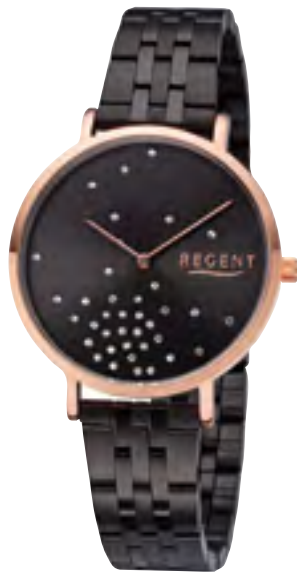
BA-595 Metall IPR, 3 Bar UVP 69,90 €