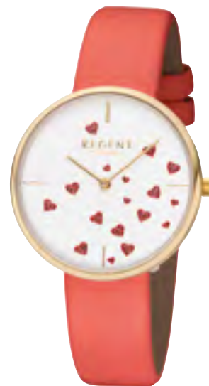
BA-609 Metall IPG, 3 Bar UVP 49,90 €