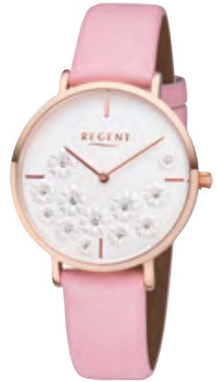
BA-593 Metall IPR, 3 Bar UVP 59,90 €