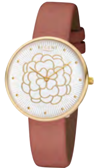
BA-605 Metall IPG, 3 Bar UVP 59,90 €