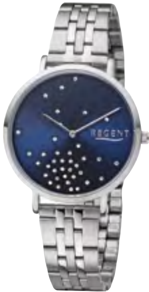
BA-594 Metall IPS, 3 Bar UVP 59,90 €

üppiger Steinbesatz für strahlendes Funkeln